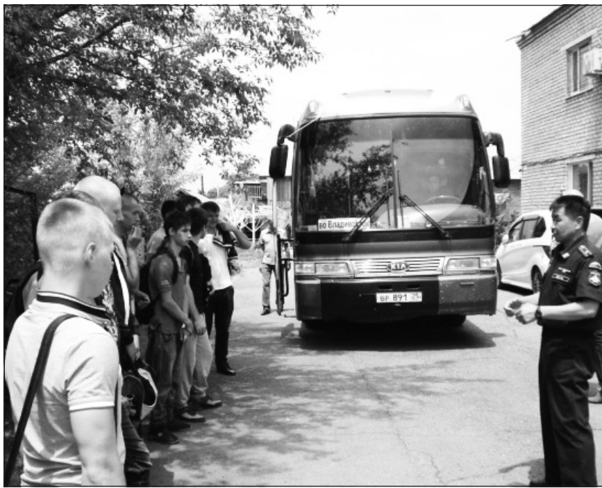
Инструктаж новобранцев перед отправкой

— У меня дочь, но она выражала желание служить по контракту. Наши дети с детства знают, что такое военная служба. У моих коллег сыновья поступили в военные училища, у некоторых даже дочери в силовых структурах, при погонах.