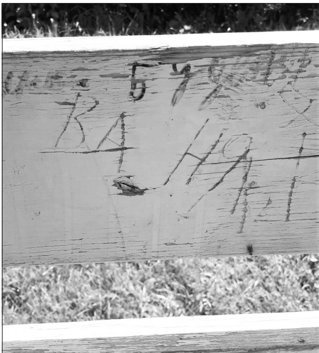
Лавочки исцарапаны, исписаны, различные элементы игровых комплексов сломаны

Мусор — это просто отдельная тема. Мусорят все: и мамы, и дети, и те, кто приходит на детскую площадку вечером. Сколько раз приходилось наблюдать такую картину: выпил ребенок сок из пакетика и бросил тут же