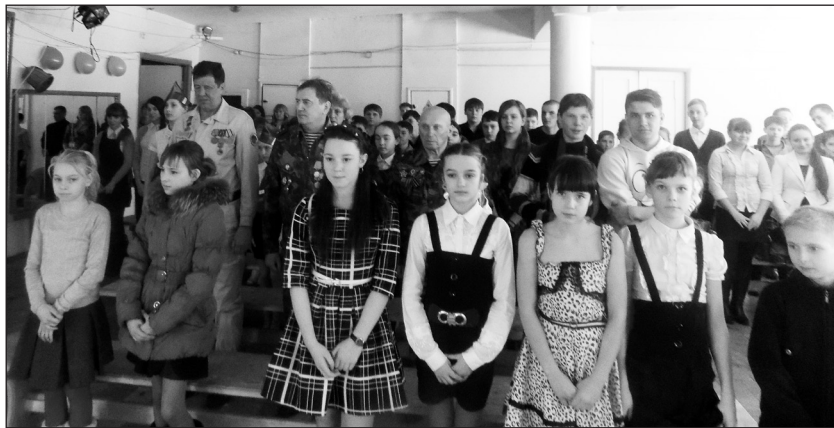
Почтили память погибших минутой молчания

- Мы потеряли в войне 13 300 человек, однако потери противника превы-