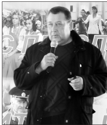
Участник боевых действий в Чечне