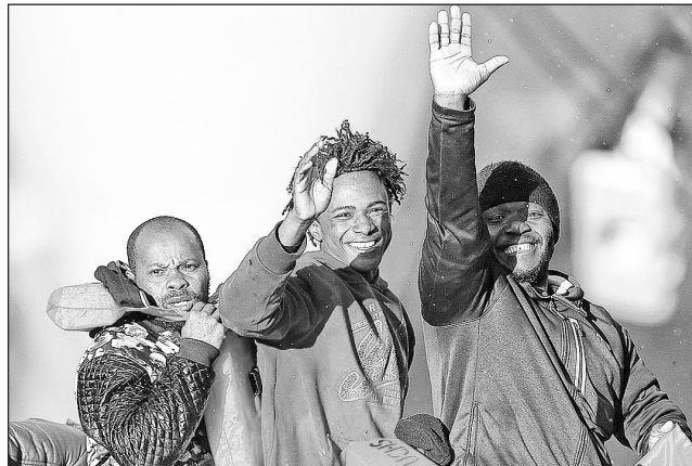
Африка и Азия перетекут в Западную Европу и к концу столетия ее облик очень изменится

К примеру, Нидерланды – первая и самая богатая колониальная империя. На момент захвата Индонезии уровень жизни голландца и индонезийца отличался незначительно. А к моменту распада империи – в 50 раз! Это в чистом виде гитлеровский рейх. У нас когда-нибудь было, чтобы уро-