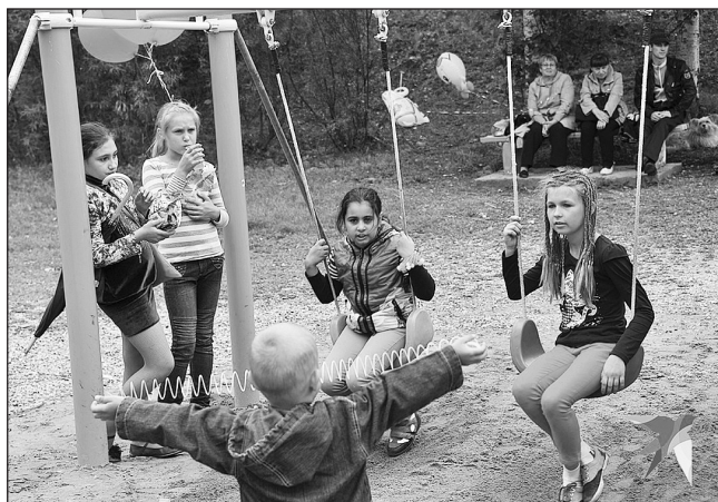
Рождаемость в деревнях всегда выше чем в мегаполисах

- Ежегодно в мире исчезает до десятка языков. Если сейчас на планете 5000 языков, то через сто лет будет 4000. Но русский сегодня – пятый по частоте употребления язык в интернете – после английского, китайского, испанского и арабского. Активность его использования выше, чем доля русских на планете. И это серьезная заявка на со-