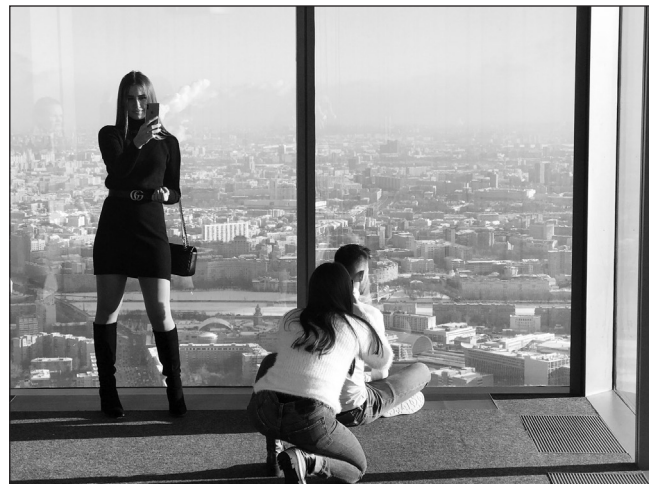
Люди, традиционно жившие в малых городах и деревнях, массово устремились в мегаполисы

Еще 19 тысяч деревень стоят без людей. А еще в 23 тысячах поселках проживают пять и менее человек. Очевидно, что это старики, и лет через 10-20 эти 23 тысячи деревень тоже станут безлюдными. В основном это Центральный, Северо-Западный, частично Поволжский округ. То есть - Нечерноземье. Пока земля была главной кормилицей, люди по ней рассредото-