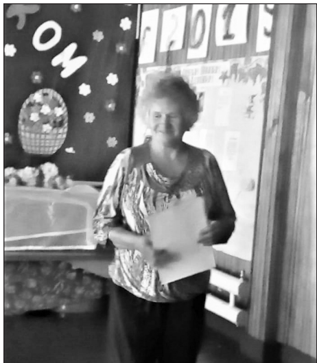
Г.Ф. Огиенко в конкурсе «Песни льются»

Ольга ЛЕВАШОВА.