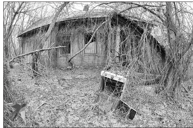
У нас за 8 лет исчезло больше 8 тысяч деревень

- А как? Сказать людям: «Не езжайте в Москву, оставайтесь в свое Ужопинске и получайте маленькую зарплату, зато у вас будет больше детей?» Люди-то мечтают, что у них будет много денег и тогда они смогут завести детей. Но так не происходит. В мегаполисах приезжие рожают одного ребенка на съемной квартире, начинают мучиться, у них карьера страдает, и они так устают с этим ребенком, что до второго руки не доходят.