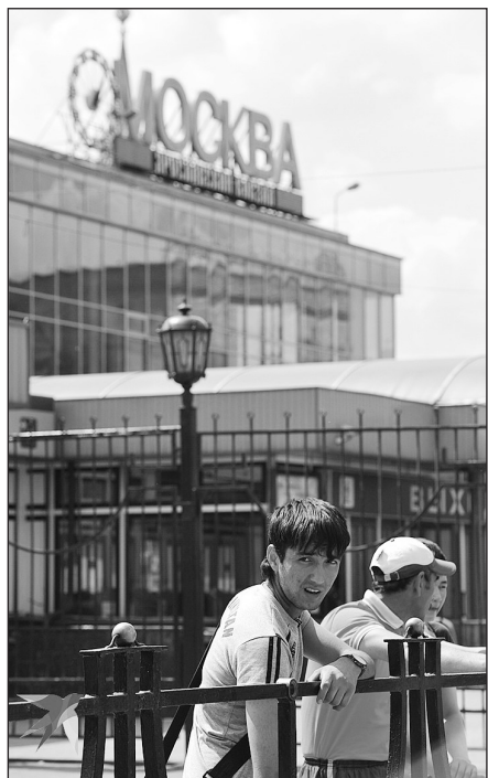
Очевидной угрозы, что в ближайшие 20-25 лет нас ждет какая-то миграционная волна нет, потому что у нас нет единой монокультурной миграции

- Я недавно путешествовал по родине моего отца - это Белевский район Тульской области. Нечерноземная часть. Раньше черноземные зоны были практически все распаханы, а