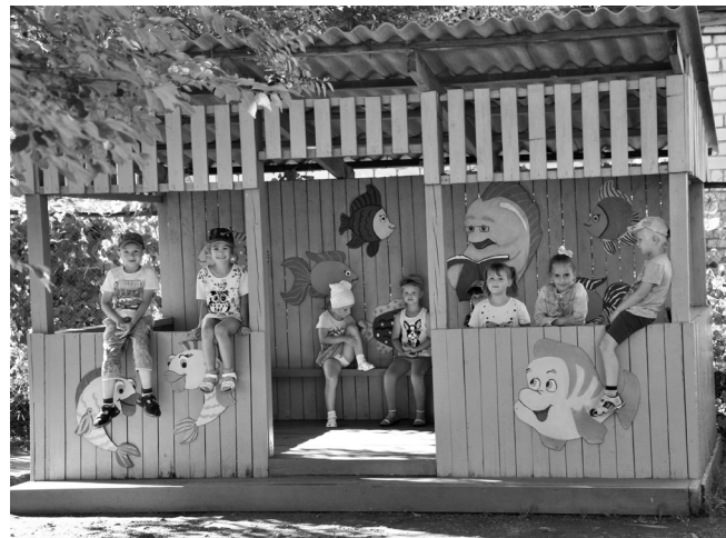
«Дело было вечером, делать было нечего»

У ребятшек помладше тоже есть свой кораблик со штурвалом, а главное, с якорем. Да и то верно, они свой «якорь опустили» в этом саду