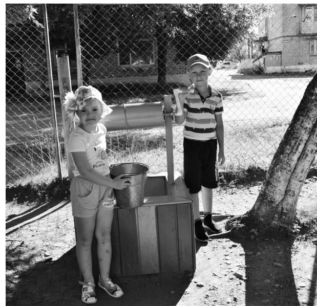
Из «волшебного» колодца напоят ребятки, чьи родители приложили свои умелые руки к его построению

Новая песочница напоминает далёкое детство, где было много радости и позитива. Детская площадка с песочницей – любимое место для игр у детей от мала до велика. Для того, чтобы песок оставался чистым,