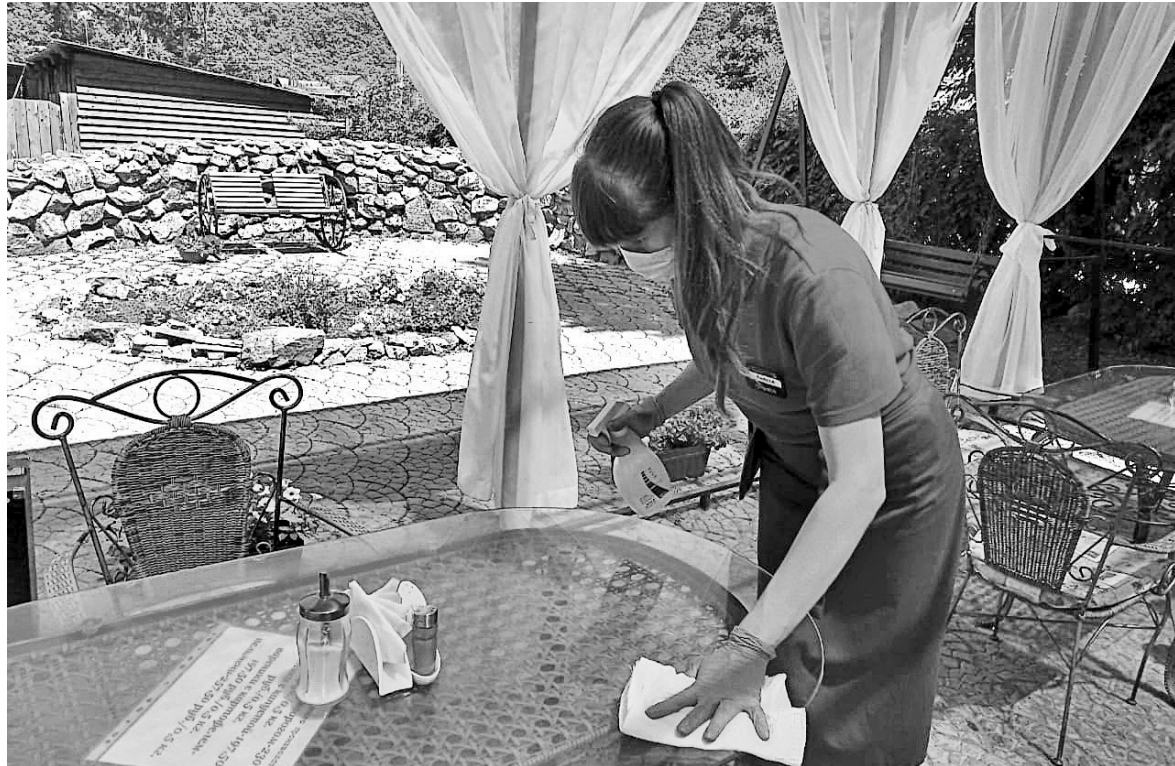
Дезинфекция рабочих поверхностей - каждые два часа.

Чтобы сделать отдых максимально безопасным, Роспотребнадзор с учетом мнения экспертного сообщества, международного опыта и при участии Минпросвещения РФ разработал рекомендации для организации