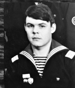
Та самая подлодка