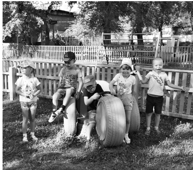
Водитель не очень хотел брать пассажиров, им только и осталось ехать на колёсах