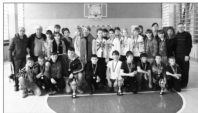
Победители и призеры соревнований.

Кто-то из обывателей, может быть, скажет, что работа по физическому воспитанию детей – это их про-