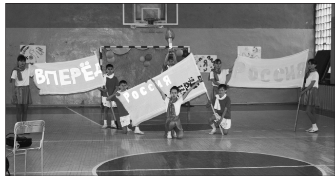
Команда школы им. А.А.Фадеева.