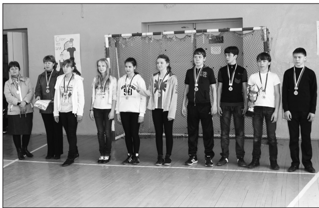
Команда - победитель (СШ им. А.А.Фадеева).