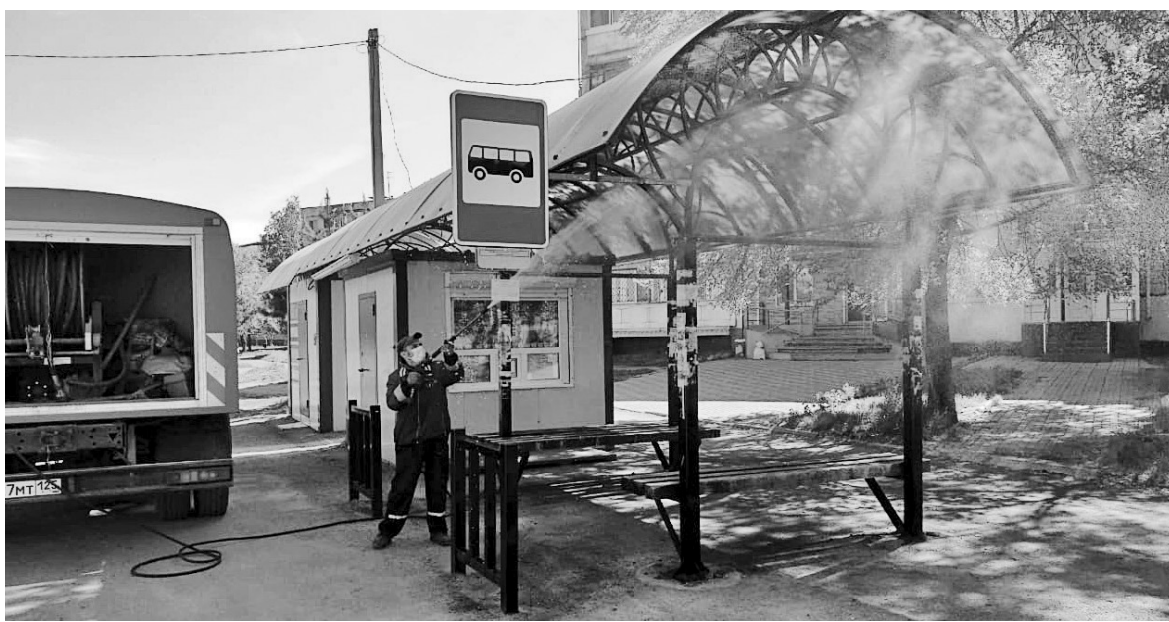
Одна из профилактических мер — дезинфекция автобусных остановок.

Мобильные группы из сотрудников административной комиссии и полицейских Находки регулярно проводят проверки крупных торговых центров, магазинов, рынков, фитнес-клубов,