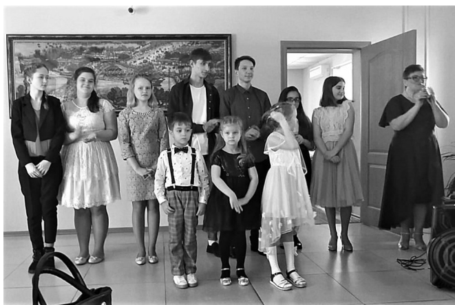
Вокальная студия «Аралия»