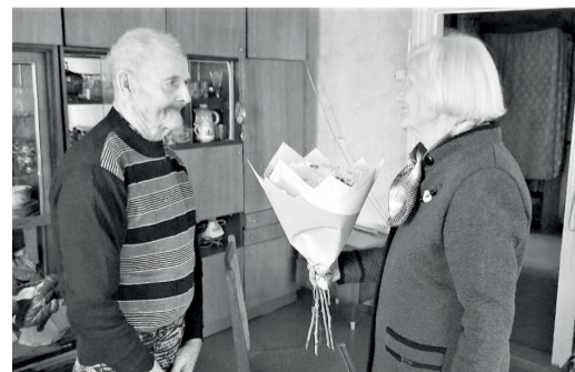
Пресс-служба администрации округа.

Пусть каждый день дарит радость и положительные эмоции, ведь это и есть залог долгожительства.