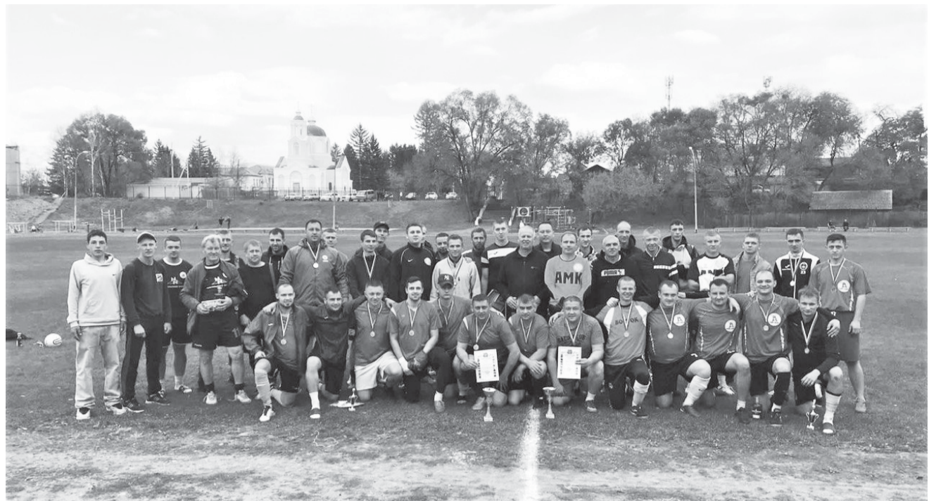
Победители и призеры Кубка

С самого начала встречи команда «Ханка» завладела преимуществом, до окончания первого тайма оформив солидную разницу в счете — 3:0. Казалось, что игра практически уже сделана, но иначе думали футболисты «Востока»: забив во втором тайме четыре мяча, хозяева поля едва не совершили невозможное, но последнее слово все-таки осталось