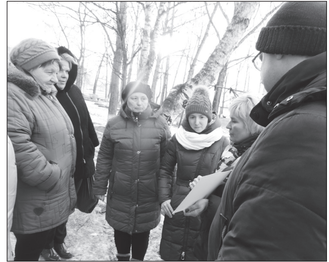
Сход граждан: с. Чугуевка, ул. Комарова, 10

В настоящий момент идет подготовка аукционной документации, торги будут проведены в ближайшее время. Все девять площадок будут разыграны одним лотом, чтобы выполнял все один подрядчик. С ним будет заключен контракт, по условиям которого работы