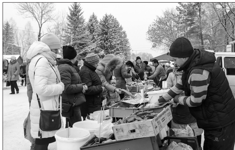
Большой популярностью пользуются ежемесячные продовольственные ярмарки

Несмотря на достигнутые результаты, в сельскохозяйствен-