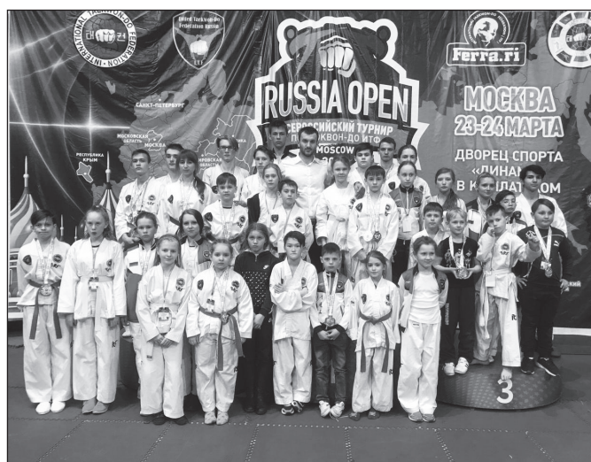
Фото с соревнований в г. Москва.