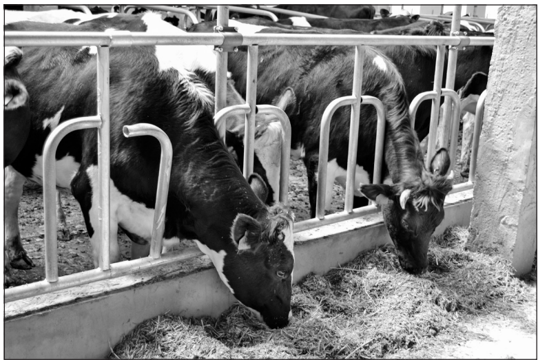
В хозяйстве К(Ф)Х Кушнарёва построена современная молочнотоварная ферма

С 1 октября 2016 года на территории района, равно как и на всей территории Дальнего Востока,