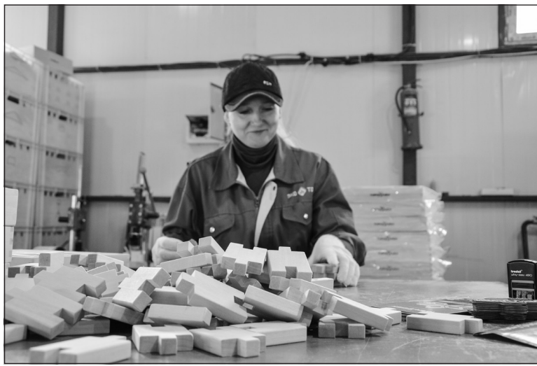
Производство деревянных игрушек ООО «Эко Тойс» на базе ООО «Тандем»