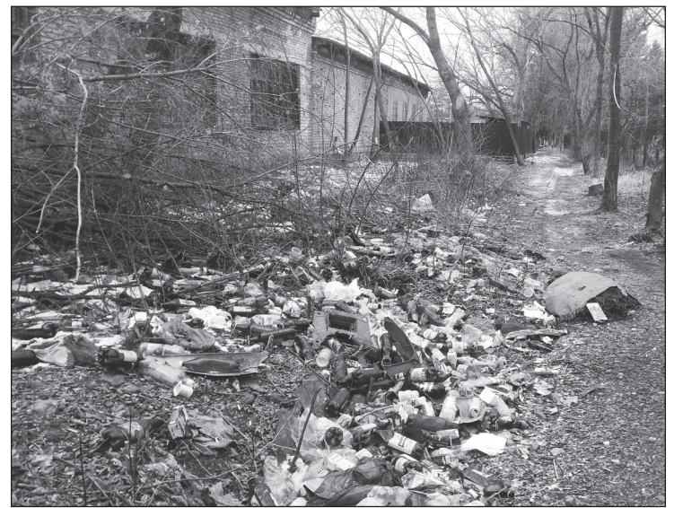
Переход с улицы Комсомольской на 50 лет Октября