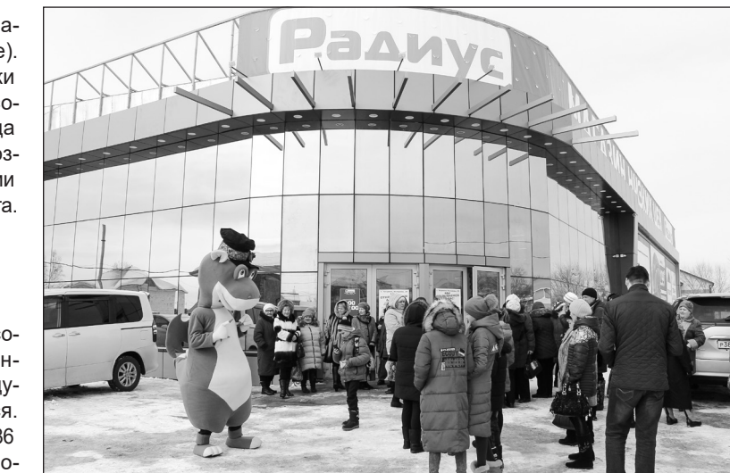
В Чугуевке открылся супермаркет «Радиус»

лена несколькими предприятиями. Хочется отметить производство деревянных игрушек ООО «Эко Тойс» на базе ООО «Тандем». Предприятие включено в перечень инвестиционных проектов, входящих в государственную программу «Социально-экономического развития Дальнего Востока и Байкальского региона». Результат реализации инвестиционного проекта — это ассортимент выпускаемой продукции (игрушек) порядка 150 видов, объем более 360 тыс. изделий в год, создание более 50 новых рабочих мест.