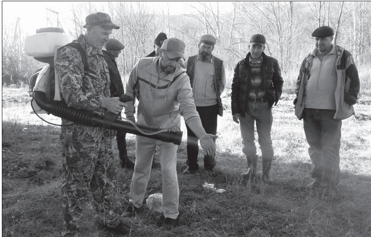
Обучение дружинников в с. Верхняя Бреевка

Сотрудники администрации Чугуевского и Шумненского сельских поселений сами входят в их состав, и чуть ли не так же часто борются с огнем, как и пожарные.