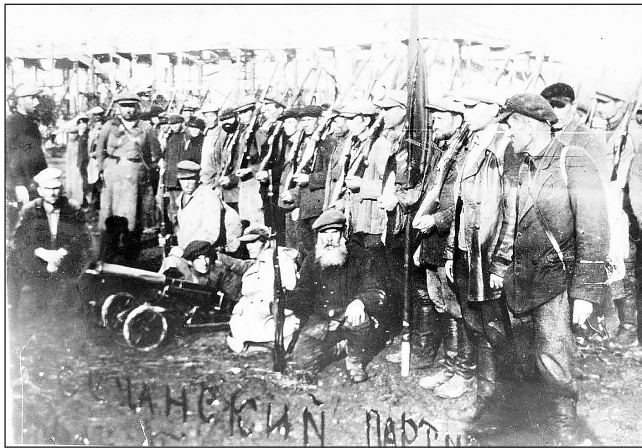
1920 г. Сучанский партизанский отряд.