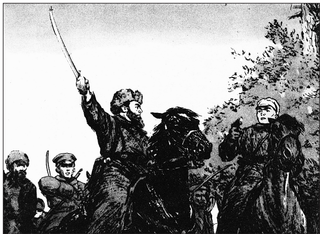
Иллюстрация к роману «Разгром»