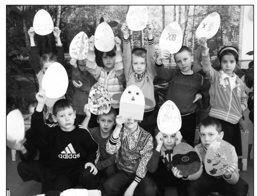
Вот такие писанки получились у 1 класса.