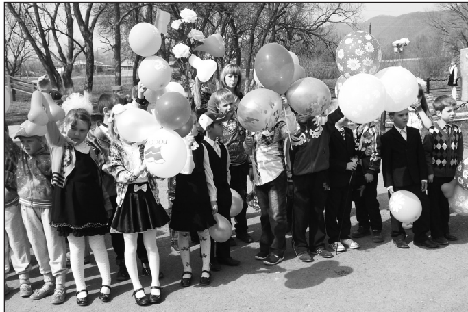
На митинге первоклашки.