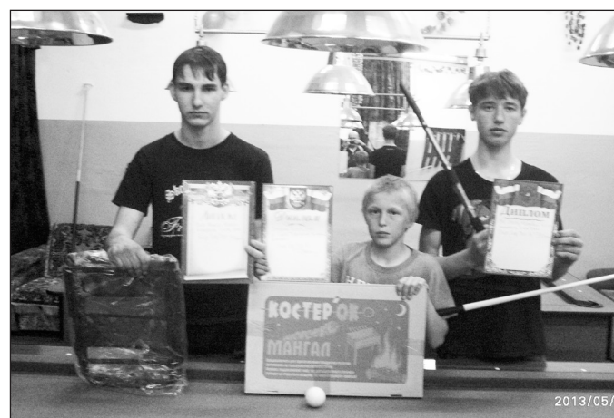
Бреевская команда бильярдистов

Победители внутреннего турнира получили от своего руководителя и на-