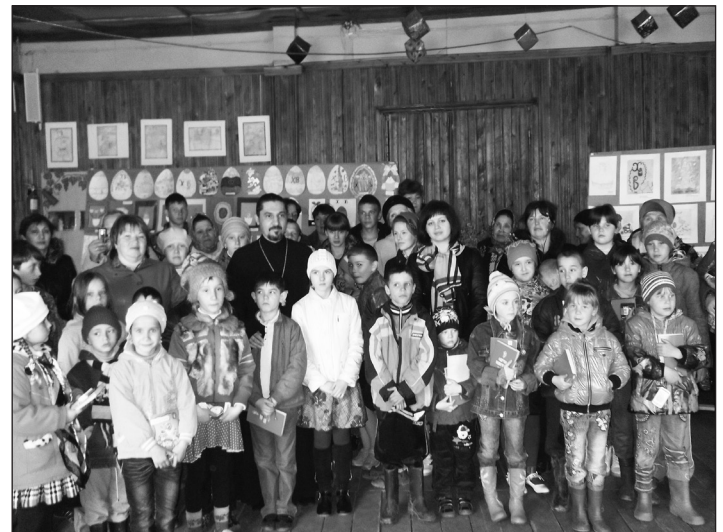
Участники конкурса «Красная Пасха».