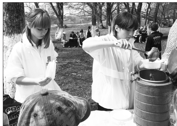
Гречневая каша для всех.