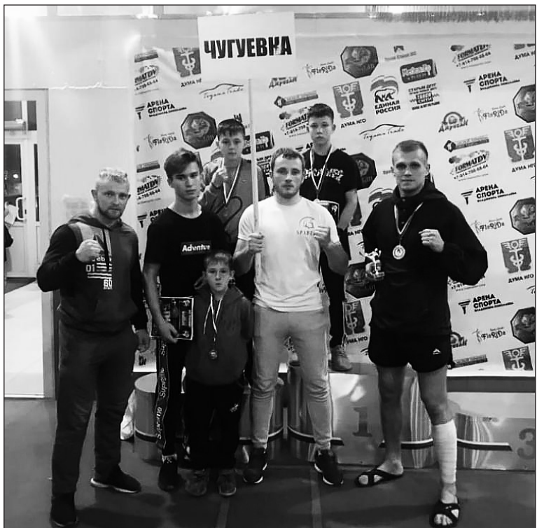
Чугуевская команда на соревнованиях по тайскому боксу в г. Находка

С 20 по 21 октября в городе Находка состоялись соревнования по тайскому боксу, в которых приняли участие команды из Владивостока, Артема, Благовещенска, Находки, Покровки и Чугуевки - в общем, порядка 80 спортсменов.