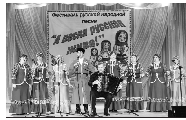
Вокальная группа «Ивушка» - «Был бы хлеб, была б картошка»