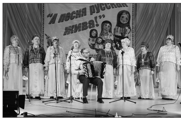
Вокальный коллектив «Зорюшка» - «На Руси никогда не умолкнут гармони»