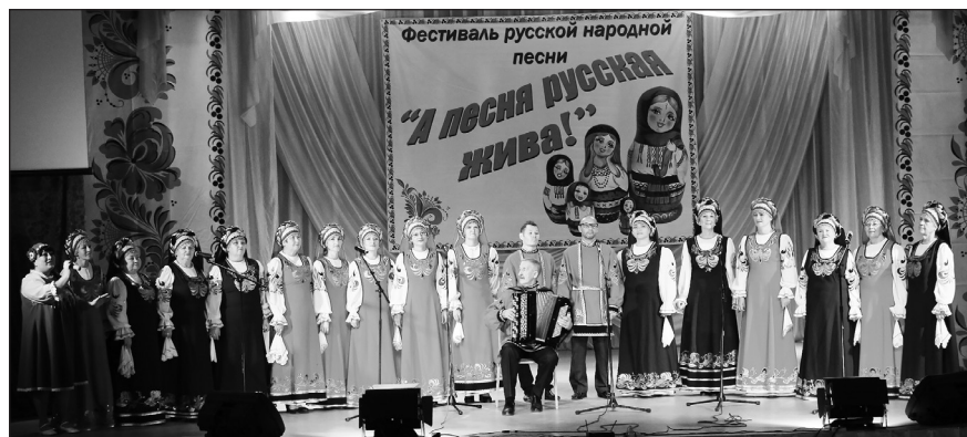
Лучшие среди «взрослых» хоровых коллективов: чугуевский хор «Орешина» и арсеньевский «Вишень»

Бодро и энергично выступила вокальная группа «Селяне» из Новосысоевки («Спать гармошка не дает») под аккомпанемент баяна, что сегодня уже редкость. Порадовали слушателей своим мастерским исполнением солистки народного самодеятельного вокального ансамбля «Русская душа» (г.