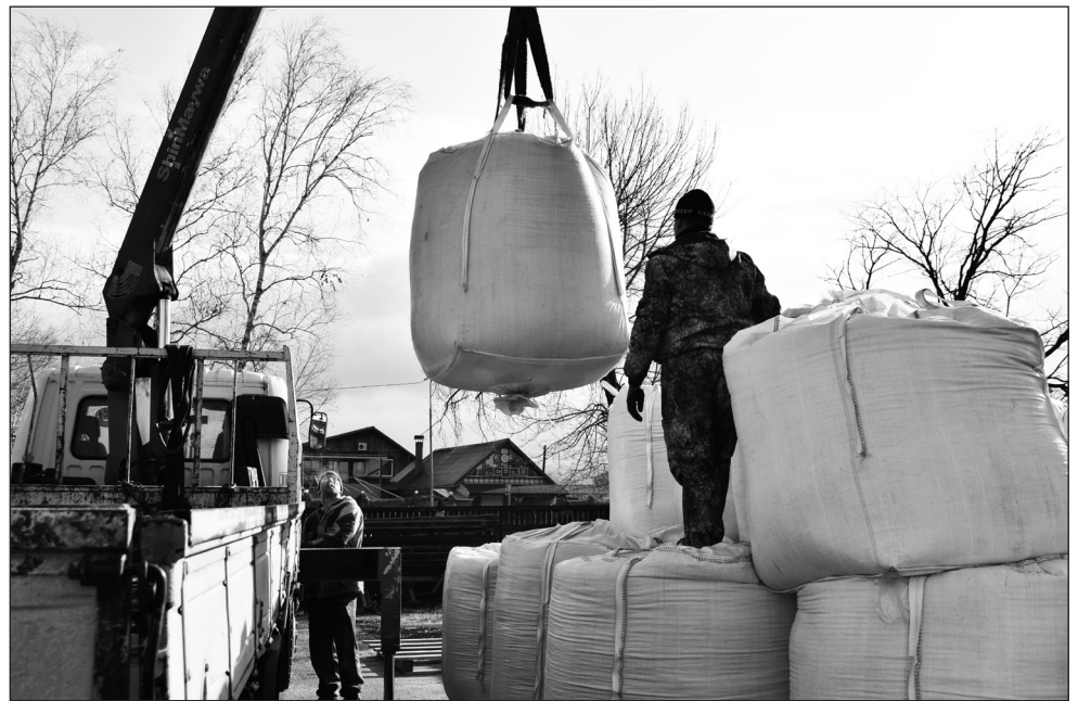
Идет погрузка сои. При этом не теряется ни зернышка

Урожай этого года хорошего качества. Уже проведены лабораторные исследования, получено заключение, подтверждающее отсутствие в корнеплодах солей тяжелых металлов и нитратов. В следую-