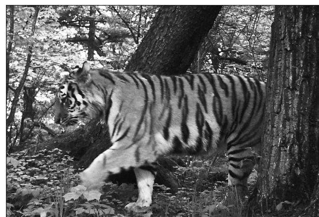
Тигр на аватарку. (Фотоловушка в НП Бикин)

Возбудитель АЧС чрезвычайно контагиозен и устойчив во внешней среде, поэтому распространяться он может контактным путём и на шинах автомобилей, и падальщиками: птицами, грызунами, мухами... Сохраняется вирус даже в продуктах мясопереработки!