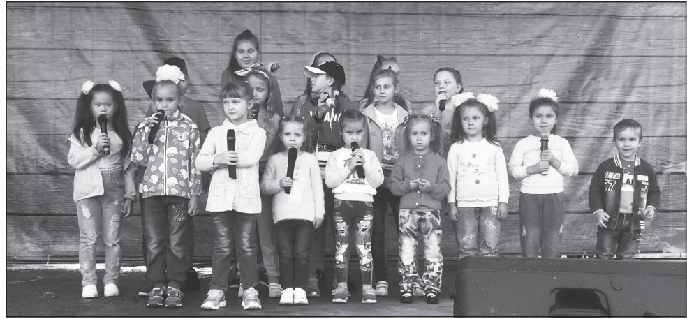
Вокальный коллектив «Подсолнушки»