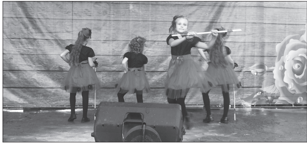
Танцевальный коллектив «Сувенир»