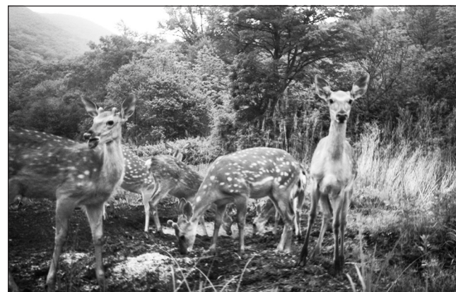
Пятнистые олени. (Фотоловушка в модельном охотхозяйстве, Приморье, WWF России)

Не стали исключением и эпизоотические события, связанные с распространением АЧС в Приморском крае в конце июля этого года. Причиной эпизоотии стало нарушение ветеринарного законодательства, выразившееся в свободном выгуле домашних свиней вблизи интенсивно используемого пограничного перехода «Пограничный-Суйфунхэ» на фоне эпизоотии АЧС в сопредельных северных провинциях Китая. Следует подчеркнуть, что до начала августа падеж диких кабанов в Пограничном районе отсутствовал, что подтверждается регулярными донесениями инспекторов департамента охотнадзора.