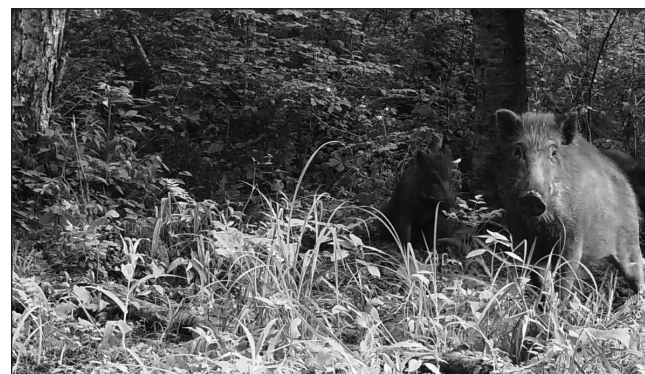
Кабан-охотхозяйство Синегорье.