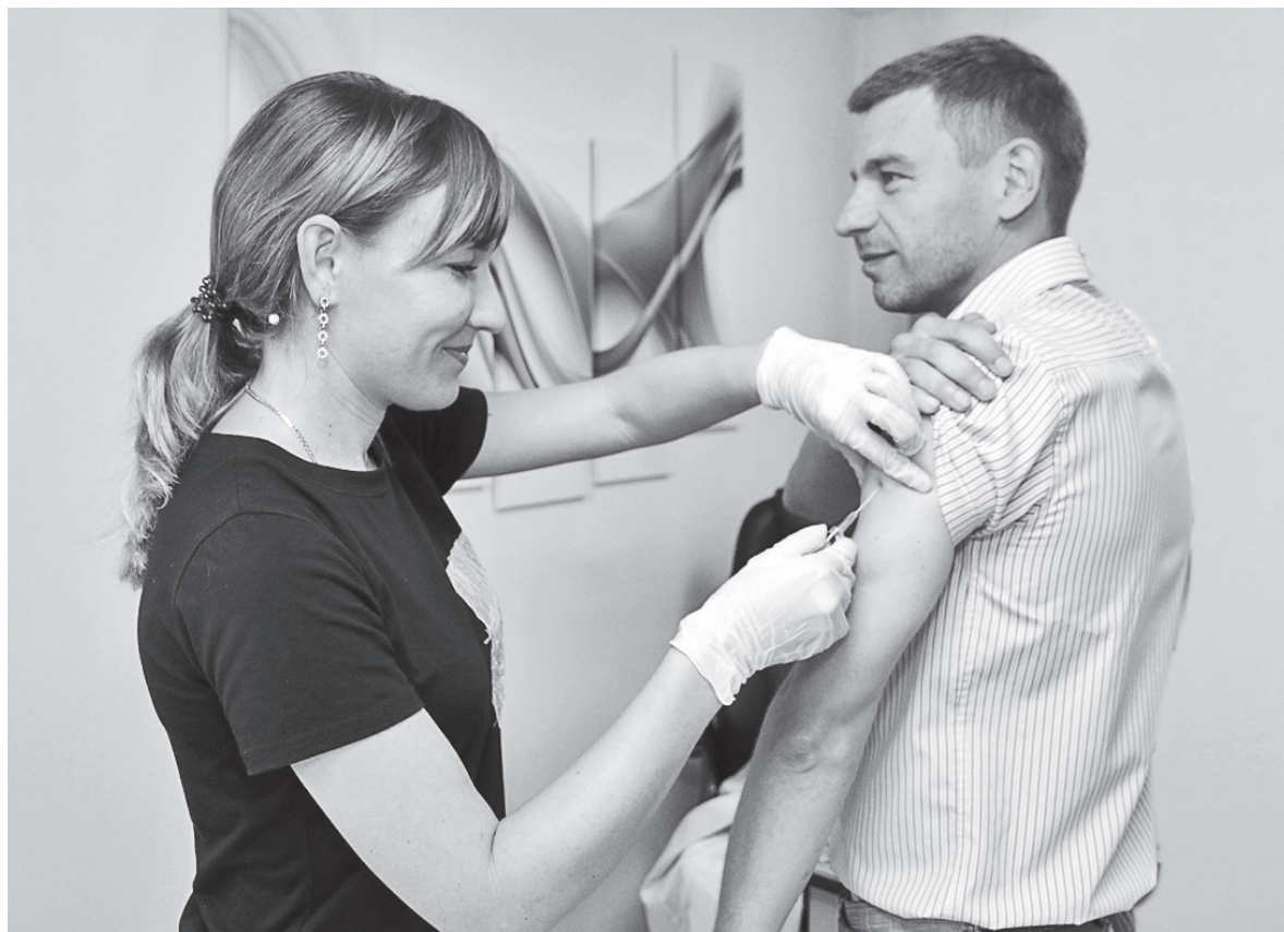
Взрослое население, не входящее в группы риска, может быть привито в частном порядке. Для этого можно пригласить в офис выездную медицинскую бригаду.

Грипп остается одним из самых тяжелых вирусных заболеваний, которое передается воздушно-капельным путем и может одновременно поражать большие массы населения. Залечь гриппом мо-