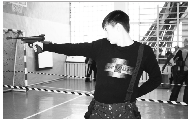
На огневом рубеже

телей и призеров соревнований! 26 октября в борьбу вступают обучающиеся 1998-1999 годов рождения, пожелаем участникам высоких результатов и спортивных побед. Сергей МЫЗНИК