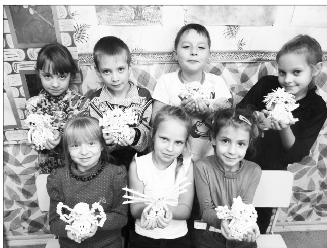
Поделки из макарон