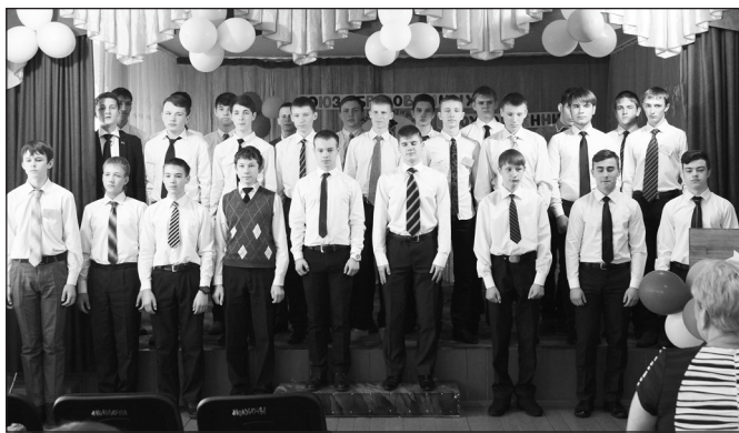
Вокальная группа школы № 2 произвела глубокое впечатление

мента всех участников как день, наполненный новыми знаниями, интересным общением, впечатлениями и яркими эмоциями. Я лично уходила с желанием учиться у таких учителей в такой вот современной школе. Понимаю, что это уже невозможно, поэтому хочется, чтобы все ребята нашего района ходили в школу с удовольствием и дружили с учителями. Фестиваль педагогических идей подарил массу эмоций и мыслей для размышления, за это и спасибо организаторам мероприятия.