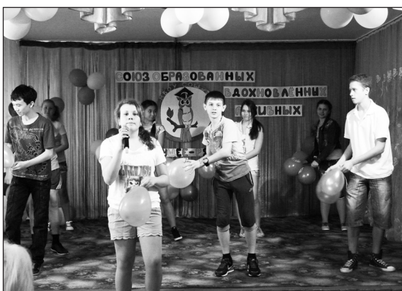
Ребята представили школьную перемену