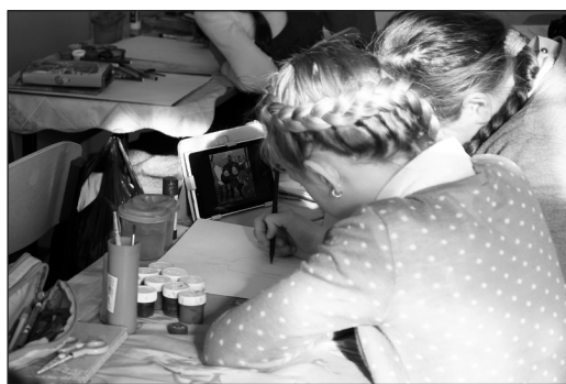
Использование планшета на уроке ИЗО в 5 «А» приветствуется