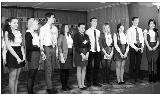
Совет старшеклассников обозначил главное в их школьной жизни