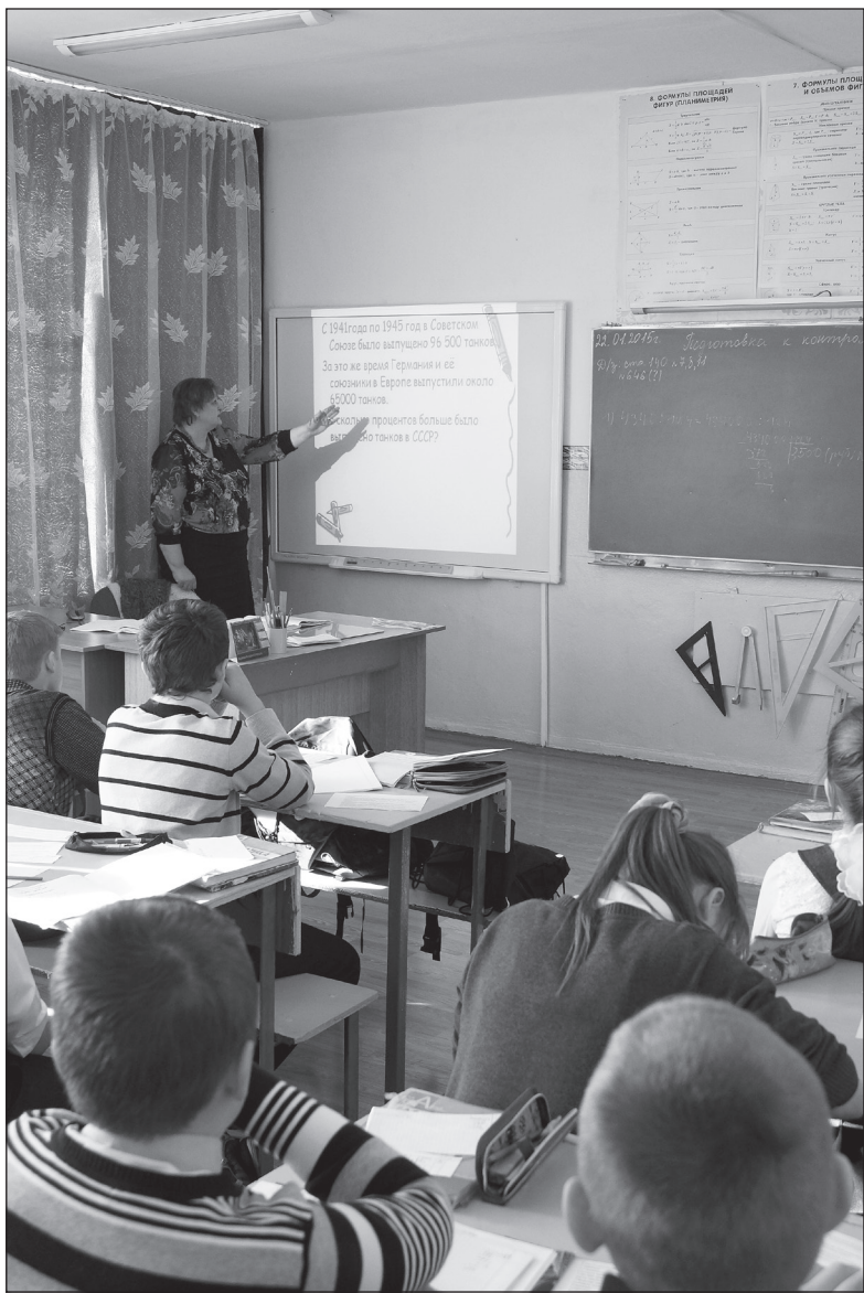
Использование интерактивной доски на уроке математики в 6 «А» классе

На базе Чугуевской средней школы №2 прошел районный фестиваль образовательных инициатив «Будущее рядом!»