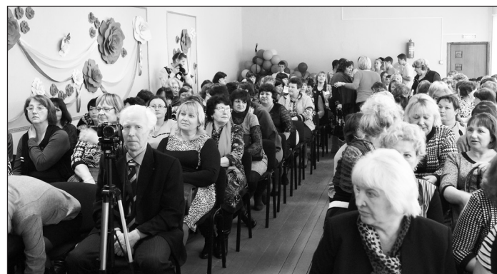
Педагоги Чугуевского района - участники фестиваля