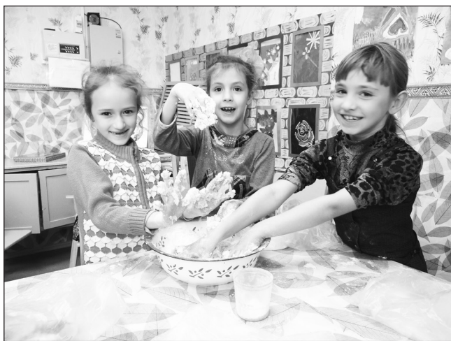
Работаем с тестом