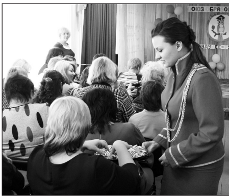
Подпитались «Витаминами творчества и удачи»