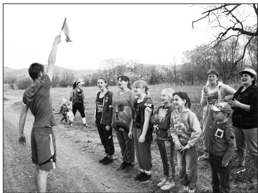
Строевая подготовка «Юрбасовцев»