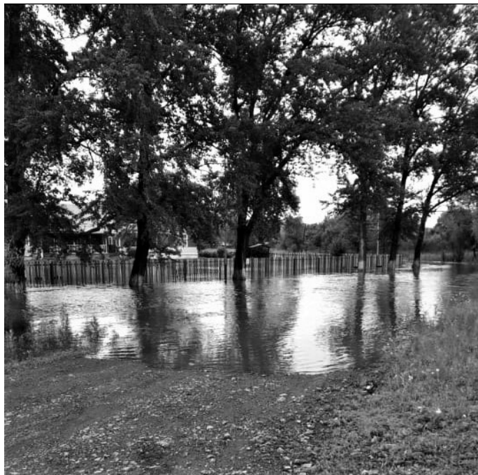
Кокшаровка, территория перед детским садом