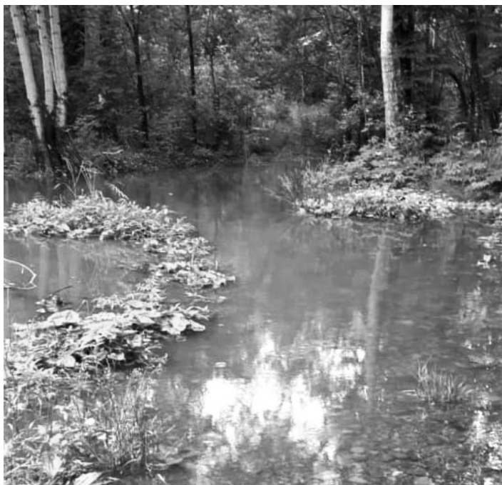
Чугуевка, дорога в «сосенки»