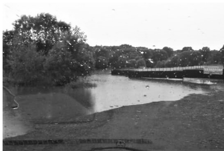
Автодром в Чугуевке