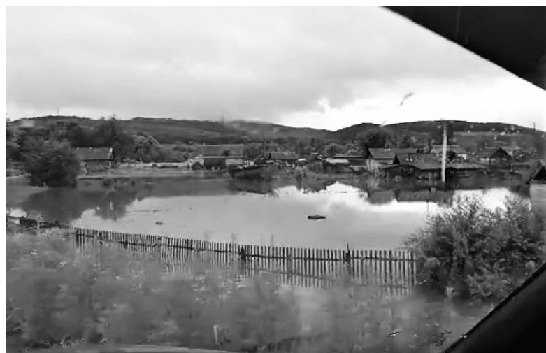
Озеро, образовавшееся в Новомихайловке