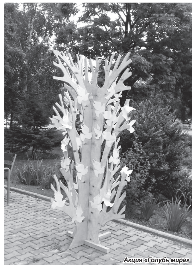
Акция «Голубь мира»

Её активными участниками стали взрослые и дети: около трёхсот человек. В течение всего дня они приносили своих голубей, вырезанных из бумаги, с написанными на