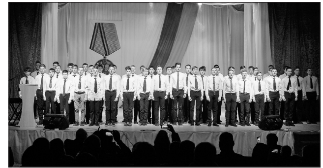
Хор юношей «Патриоты России»

чественной войны, пожелал всех благ, счастья и удачи, и, пользуясь случаем, обратился к допризывной молодежи, нашему молодому поколению: «Любите свою страну, будьте истинными патриотами, чтите память, подвиги ваших дедов и отцов, чтобы 23 февраля, когда вас будет поздравлять женский коллектив, смущенно не прятать и не опускать глаза. Яркий пример подвига, стойкости,