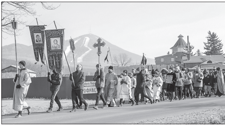
Молодежный крестный ход