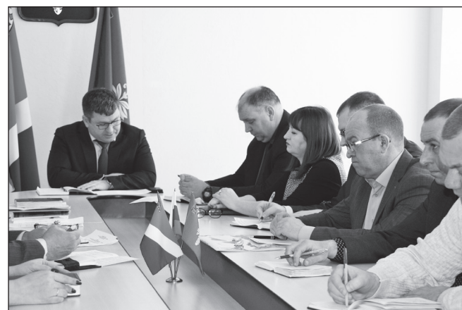
рейд на предмет выявления предпринимателей, которые не осуществляют уборку и

Еще одним «весенним бонусом» традиционно являются мусор и грязь, которые появляются, как только сходит снег. Учитывая погодные условия, принято решение о переносе начала двухмесячника по наведению санитарного порядка и благоустройства Чугуевского муниципального района с 1 апреля на 1 марта. Необходимо уже сейчас проводить субботники и наводить порядок в селах района. Особое внимание будет уделено торговым объектам, на текущей неделе начнется