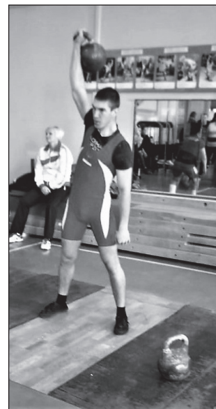
Фото со Спартакиады предоставлено управлением социально-культурной деятельности администрации Чугуевского муниципального района.