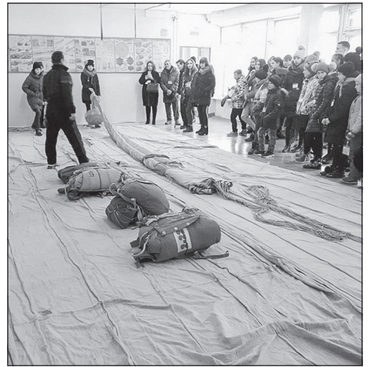
Занятия по подготовке к прыжку с парашютом

нимателями и государственными структурами.