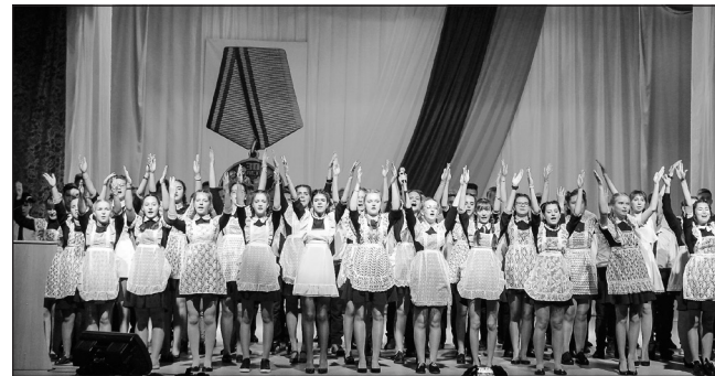
Хор девочек школы №2