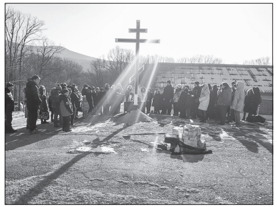
Установка поклонного креста на базе «Салют» г. Арсеньев