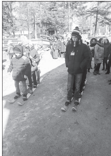
Соревнования на лыжах