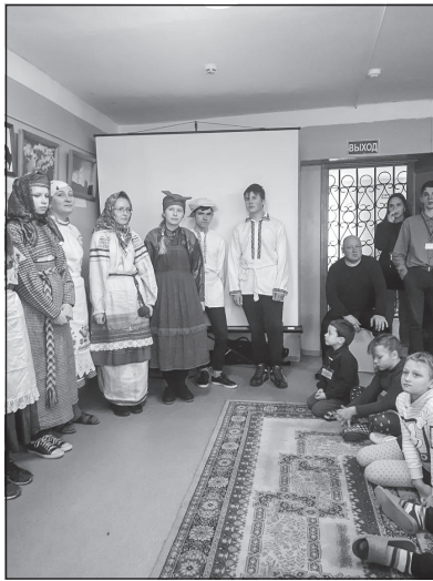
Лекция о русском народном костюме