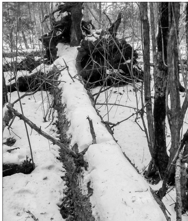
Ветровал - к категории валежника не относится, заготавливать нельзя

Необходимо отметить, что до принятия Закона о валежнике, граждане, собирающие такую древесину, считались правонарушителями и в качестве наказания могли привлекаться не только к ад-