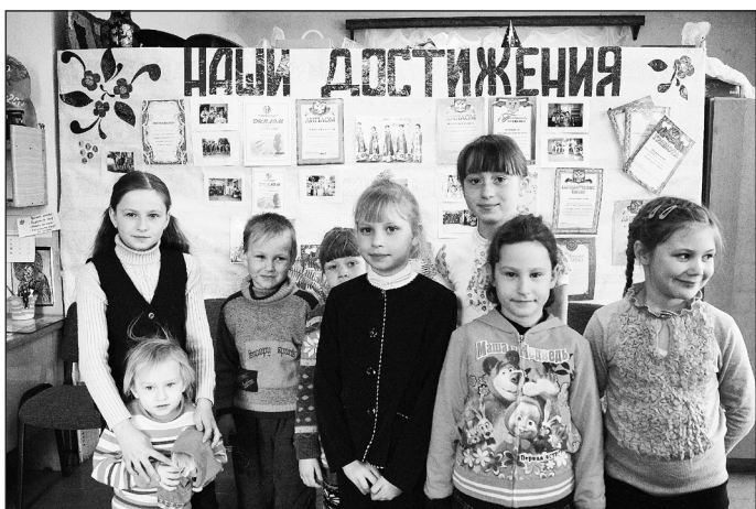
«Улыбка» на фоне грамот и дипломов клуба