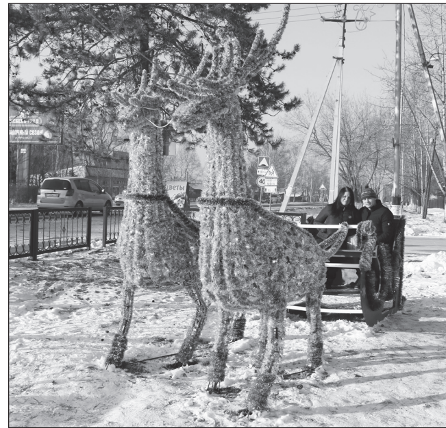
Сказочная повозка деда Мороза активно используется чугуевцами как фотозона.

Цель арт-объекта – создание новогоднего настроения у моих земляков. Фотографируйтесь с ними, как фантазия подскажет, можно на их фоне, можно сидя в санях. Только на самих оленей не залазьте, пожалуйста, они под напряжением». О том, что олени под на-