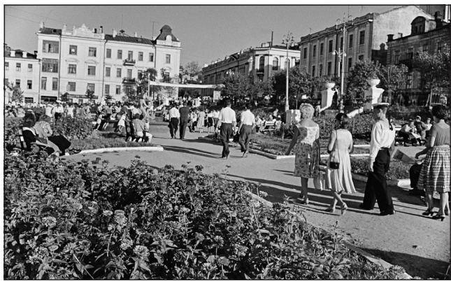
Владивосток 1955 год

год «парящего орла»? Ситуация в мире по-прежнему неспокойная, но пусть все бури не коснутся нашей страны. Пусть для нашей страны наступивший год будет таким же стабильным и процветающим,