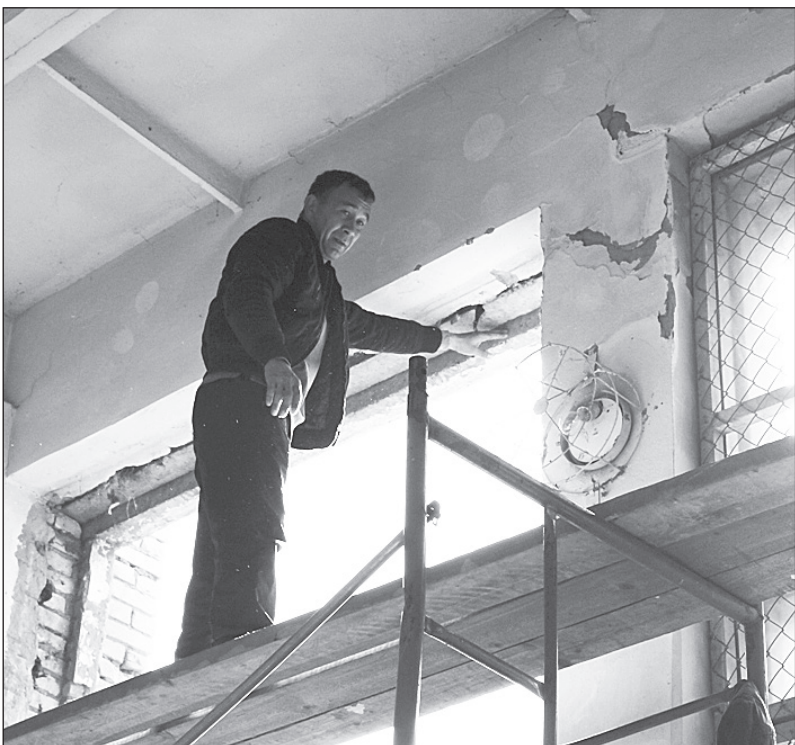
Демонтаж окон в школе №9, с. Каменка