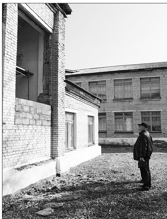
Подготовка к ремонту в школе № 9, с. Каменка