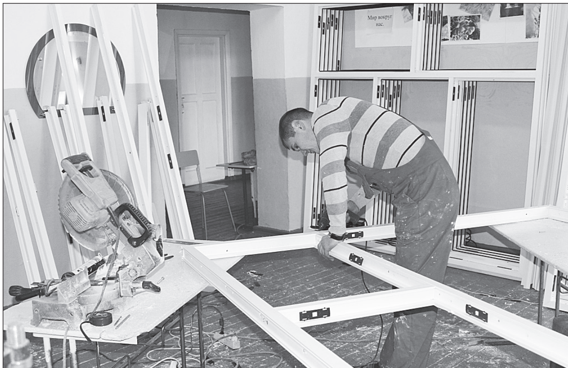
В школе №6