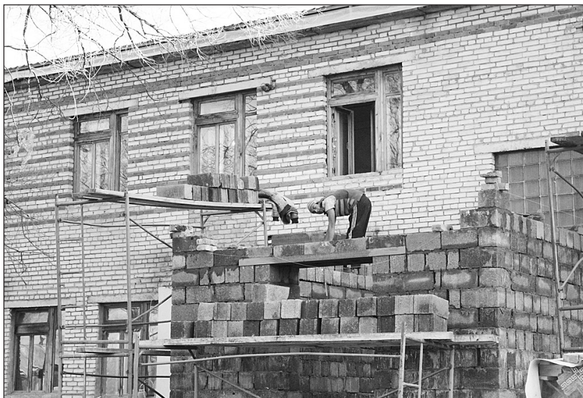
Детсад №4, с. Чугуевка