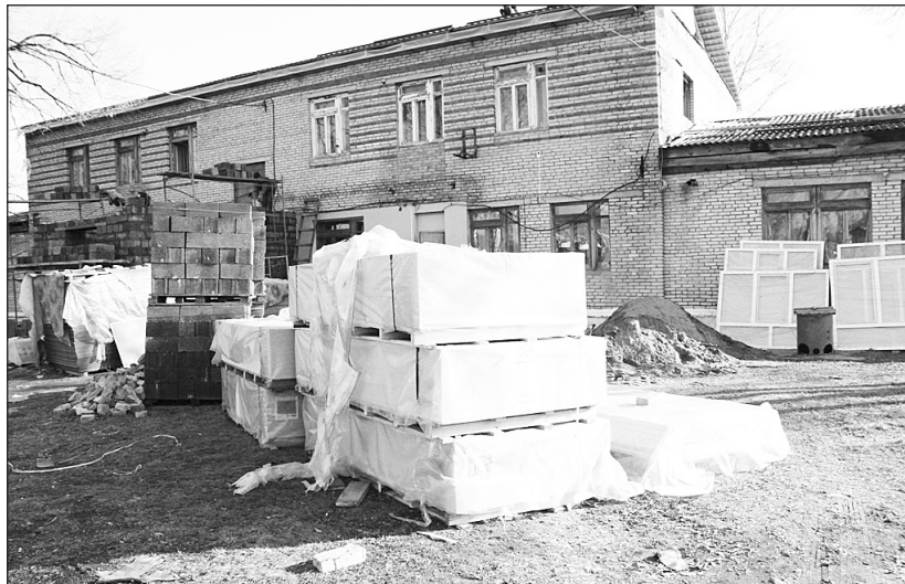
Подготовка нового детского сада №4 по ул. Лазо, с. Чугуевка