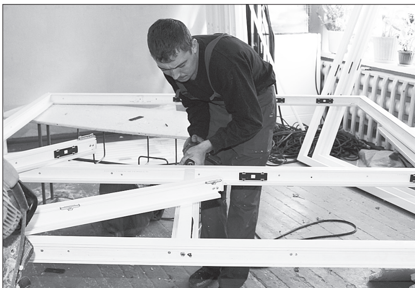
В школе №6

Кипит работа и в других школах. В школе имени А.А. Фадеева запланирован ремонт нескольких кабинетов (установка оконных и дверных блоков из ПВХ, замена светильников, покрытий полов); в школе №4 с.Кокшаровки будет произведен ремонт кровли с частичной заменой стропильной системы, водостоков, в конце октября заключен контракт на эти работы. В березовской школе будет проведен завершающий и оттого не менее важный этап необходимых работ - замена кровельного покрытия и устройство водосточной системы.