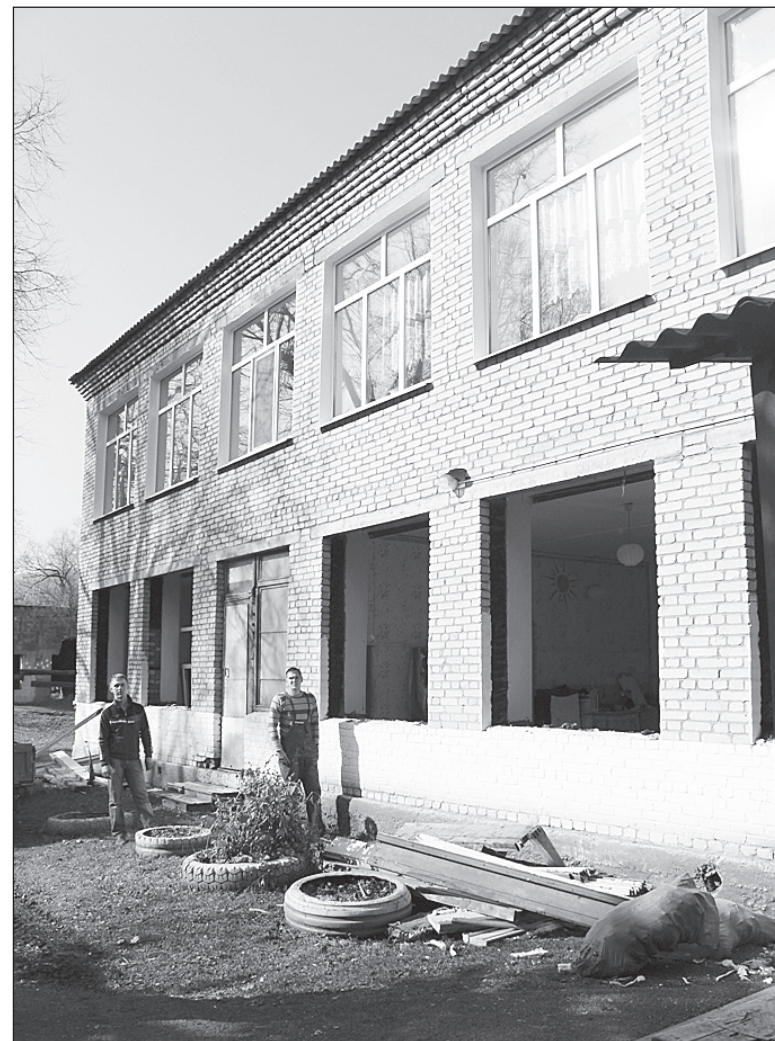
Второй этаж уже с новыми окнами, школа №6, с. Самарка

Таким образом, в школах, где много лет не проводился капитальный ремонт, в этом году будет выполнен большой объем работ, в