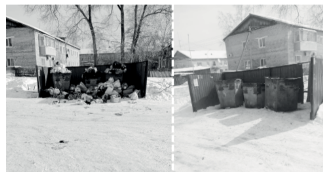
По обращению граждан территория мусорной площадки приведена в порядок

ском, который формируется администрацией, а для того, чтобы оставить заявку, необходимо позвонить по телефону 22303 или 21959.