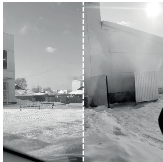
Проведены работы по уборке снега и ограждению места по сбору мусора возле магазина Family City