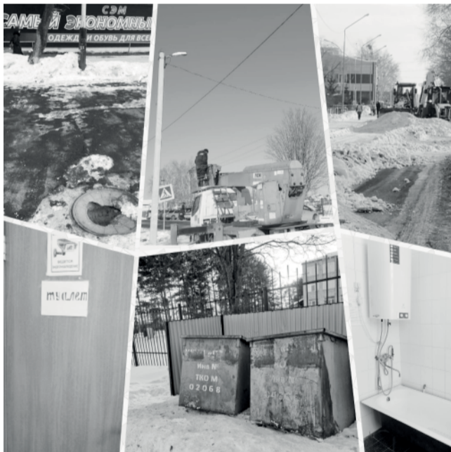
«Чистый округ» отметил небольшую дату – 1 месяц с начала работы группы