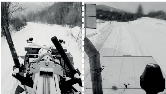
МБУ «СКС» проводится работа по уборке улиц от снега в селах Архиповка, Медвежий Кут