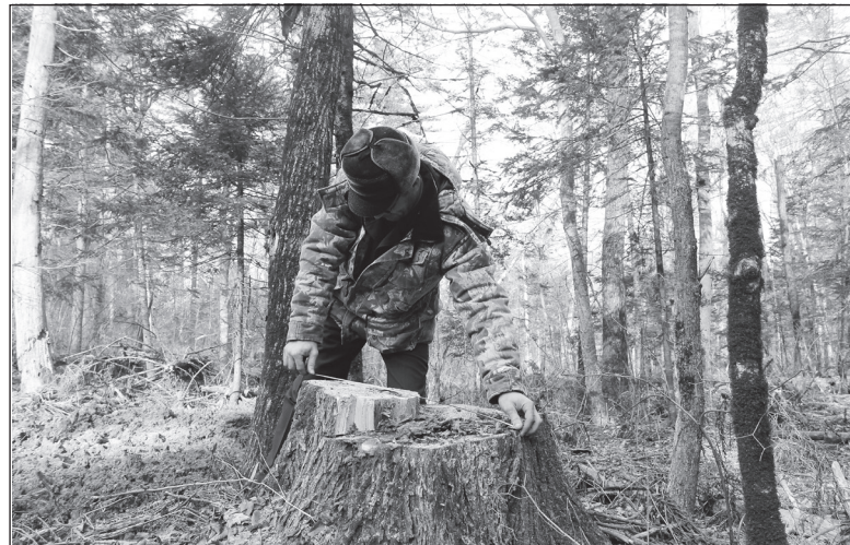
Участковый лесничий проверяет соблюдение правил заготовки — осадку порубочных остатков