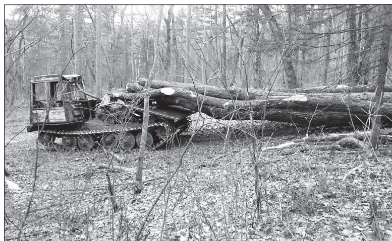
Процесс заготовки древесины

ево, и... не обнаружили ни одного свежезовезденного дома. Максимум, что было построено нового, — банька или кухня. Нетрудно догадаться, как реализовали граждане свои 100 кубов.