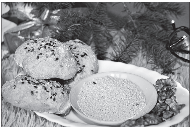
Угощение для хозяйки года