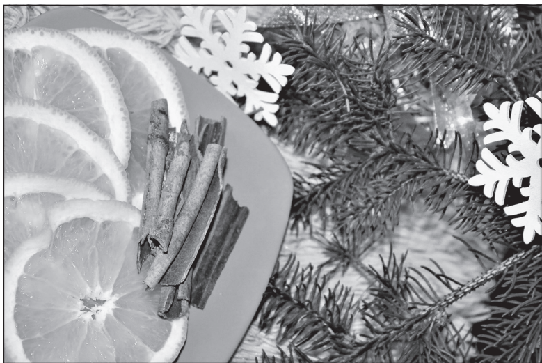
Апельсины с корицей