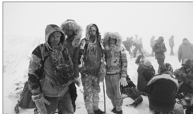
Погода на вершине