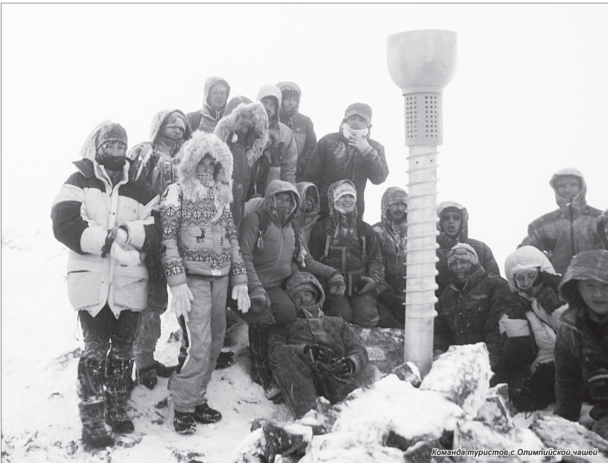
Команда туристов с Олимпийской чашей

В рамках проведения Олимпиады «Сочи 2014» во всех крупных городах России проводится масштабная акция – эстафета Олимпийского огня. Частица этой акции попала и в наш район – инициативная группа туристов приняла решение после официальной церемонии эстафеты организовать ее продолжение и вознести олимпийский огонь на самую высокую вершину Приморского края – гору Облачную.