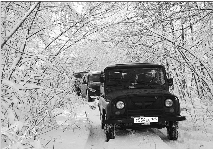
По такой дороге приходилось пробиваться