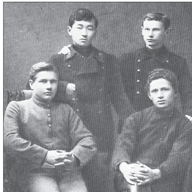
Группа учащихся коммерческого училища. Справа стоит - Александр Фадеев.

Даже на «Молодую гвардию» - текст и хронологически, и тематически далёкий от приморских реалий - повлиял дальневосточный опыт Фадеева. Сам писатель говорил, что подпольщики Донбасса и шахтёрская тема близки ему уже потому, что он работал в подполье и знал шахтёров Сучана. И вот молодого гвардейца в фашистском застенке поют про «штормовые ночи Спасска», а лирическое отступление «Друг мой! Друг мой!.. Я приступаю к самым скорбным