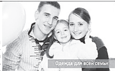
Одежда для всей семьи

Мы предлагаем вам большой ассортимент женской, мужской, детской одежды и обуви по очень доступным ценам. Открытие магазина в среду 20 ноября в 12-00!!!! Ждем вас по адресу: 50 лет Октября, дом 243, район Сухой речки. Работаем без выходных с 10-00 до 19-00.