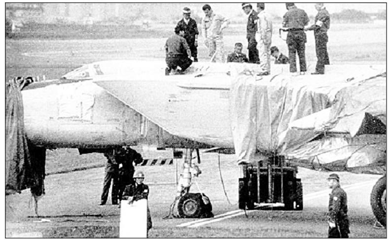
Беглый осмотр самолета представителями полиции Хакодате. По мнению экспертов, советская авионика отставала от западной.