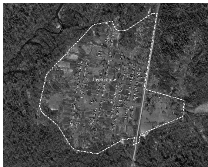
Схема границ территории ТОС «Лесогорский» села Лесогорье

Условные знаки: ----- граница территории ТОС «Лесогорский»