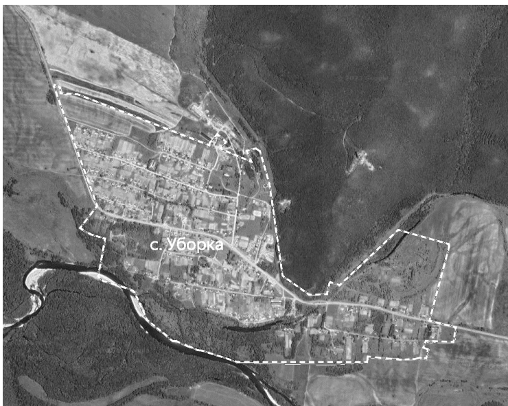
Схема границ территории ТОС «Уборка» села Уборка

Условные знаки: ----- граница территории ТОС «Уборка»