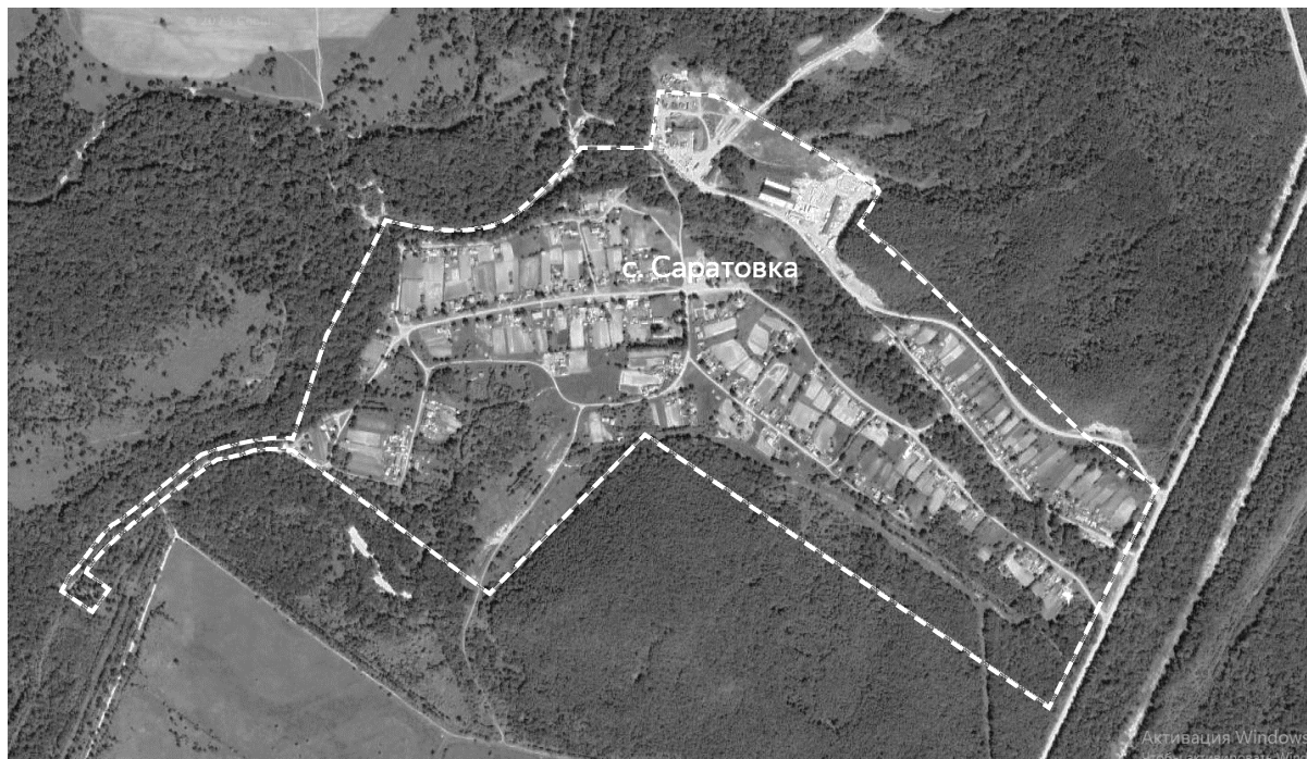
Схема границ территории ТОС «Саратовский» села Саратовка

Условные знаки: ----- граница территории ТОС «Саратовский»