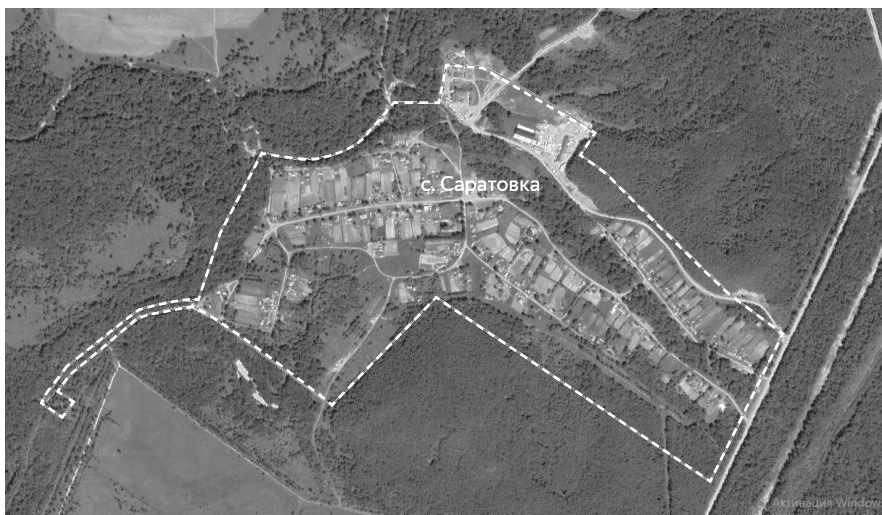
Схема границ территории ТОС «Саратовский» села Саратовка

Условные знаки: ----- граница территории ТОС «Саратовский»