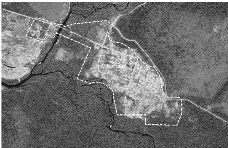
Схема границ территории ТОС «Заветнинский» села Заветное

Условные знаки: ----- граница территории ТОС «Заветнинский»