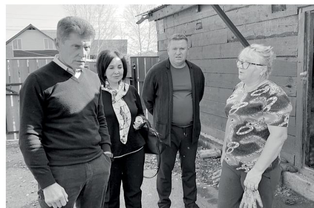
воднения и сентябрьского тайфуна «Хиннамнор» введен режим ЧС федерального уровня.

Напомним, в Приморье в результате июльского на-