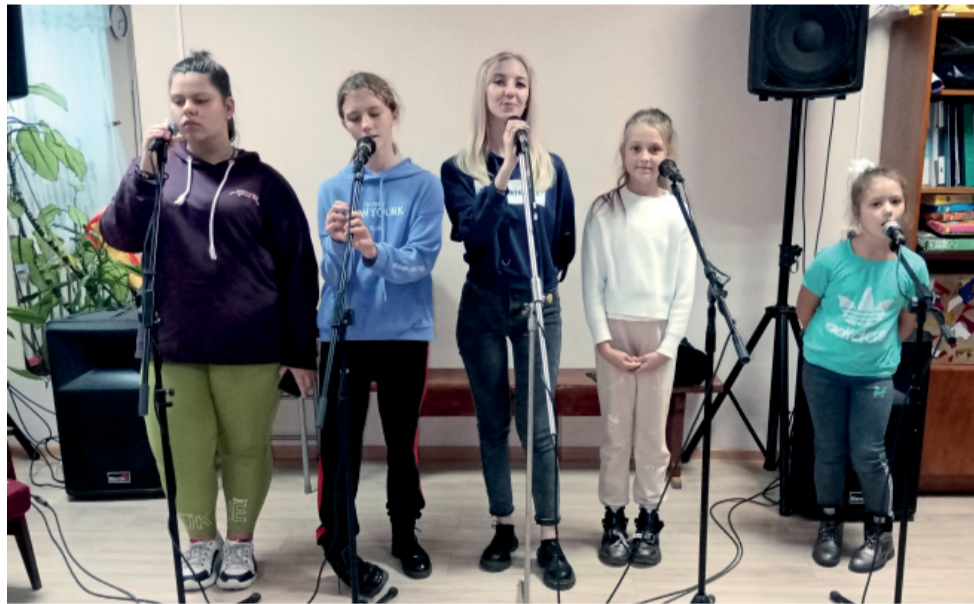
...и на репетиции

буквально в десяти минутах езды от города Сумгаит и в часе езды от Баку, но эти две недели запомнились навсегда.