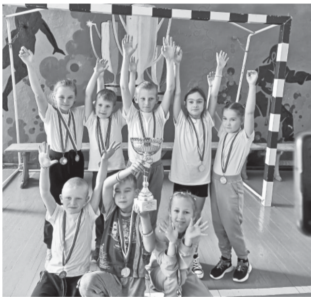
Официальный командный зачет всех участников Спартакиады (сумма всех участников)