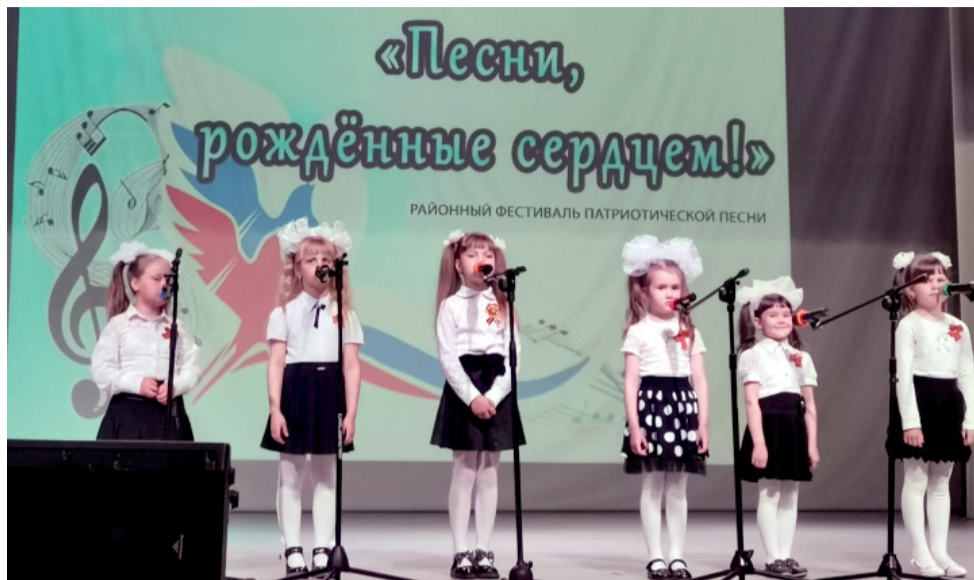
«Домисольки» на сцене

Семья с двумя маленькими детьми приехала в Азербайджан в феврале. Одеты по-теплому, потому что уезжали из снегов и морозов, а там - можно сказать, весна, ноль градусов на улице. Сначала разместились вблизи аэродрома, в санитарной части возле города Кировобад, затем перешли в офицерское общежитие. Вокруг только виноградники, обдуваемые со всех сторон. Глухомань, где не было даже магазинов, много неудобств и холодно в комнатах. Две недели так промучились, пока не перевели в поселок Насосный,