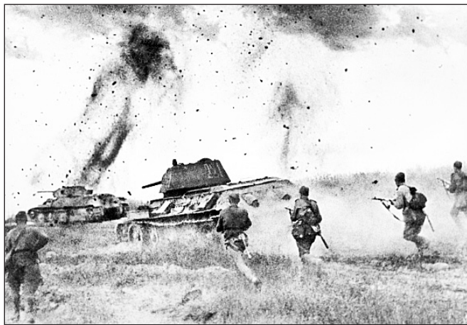
Наступление советских войск на Курской дуге.

Цена победы советского народа над фашизмом была огромной. Через войну в рядах Советских Вооруженных сил прошло более 29 млн человек. Всего в 1941-1945 гг. против Германии и ее союзников действовало 39 фронтов, было сформировано 70 общестественных, пять ударных, 11 гвардейских и одна отдельная Приморские армии. Воина унесла по приблизи-