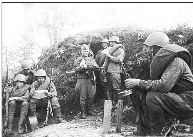
Бойцы читают почту. Курская дуга, 1943 год.