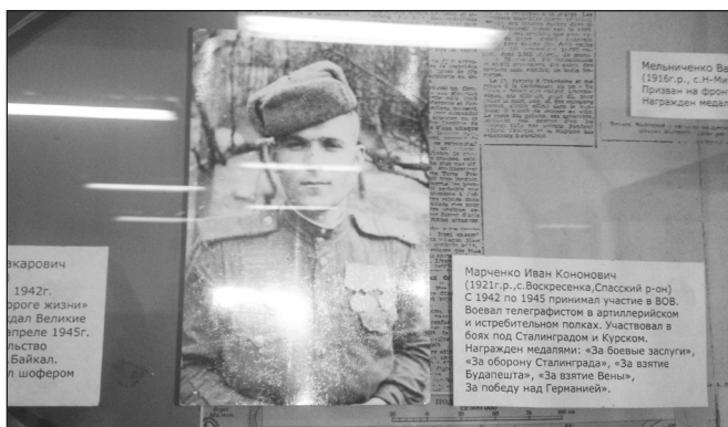
Фрагмент экспозиции музея А.А. Фадеева

тельным подсчетам свыше 27 млн жизней наших сограждан, в том числе свыше 11 млн воинов на фронте. В фашистской неволе оказалось около шести млн советских граждан. СССР потерял 30% своего национального богатства.