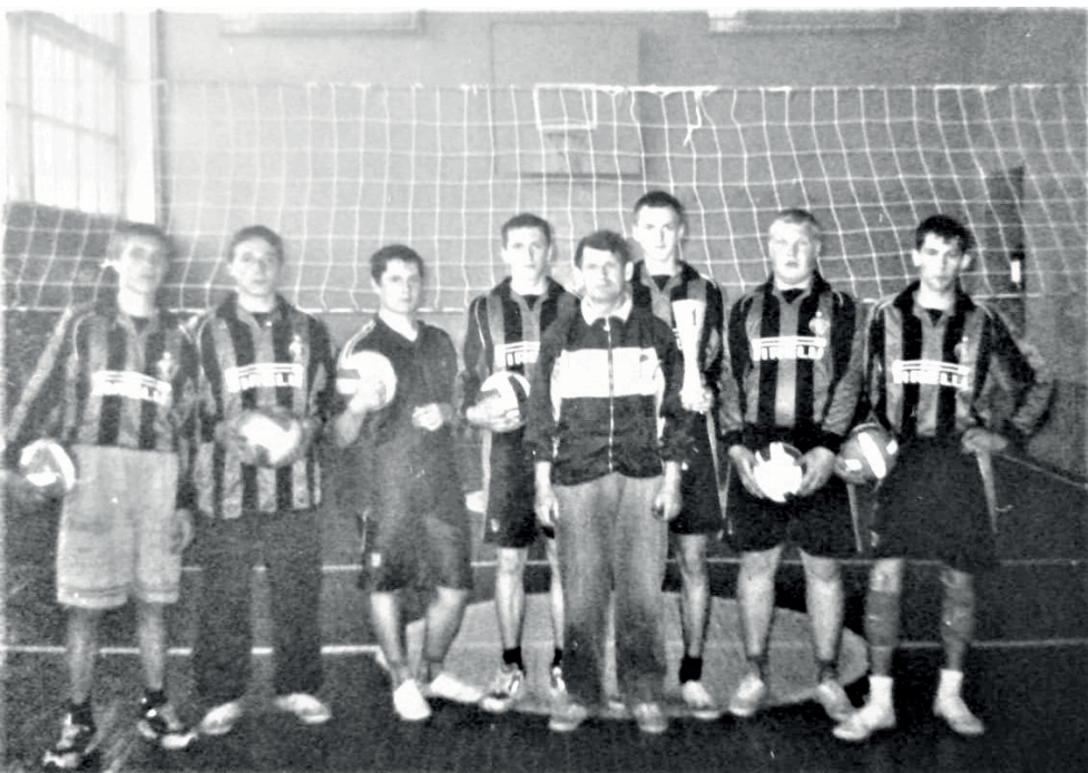
Чемпионы спартакиады школьников края