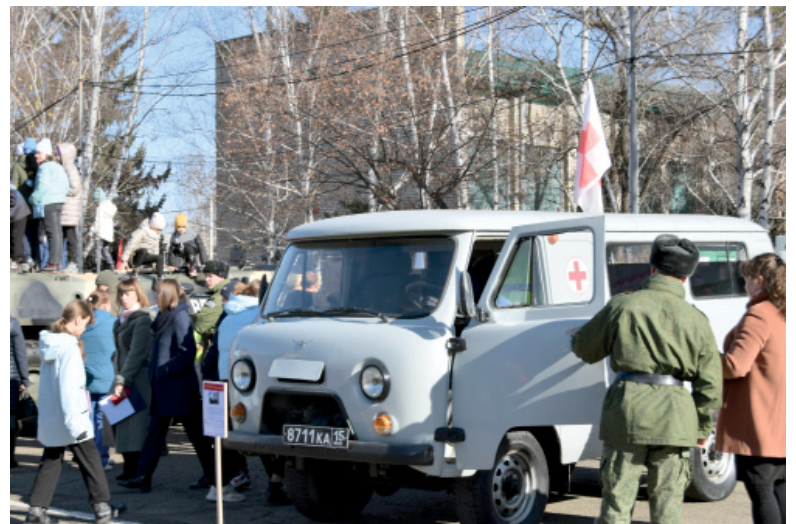
Старый добрый УАЗ – незаменимый помощник и в мирное время, и в боевых условиях