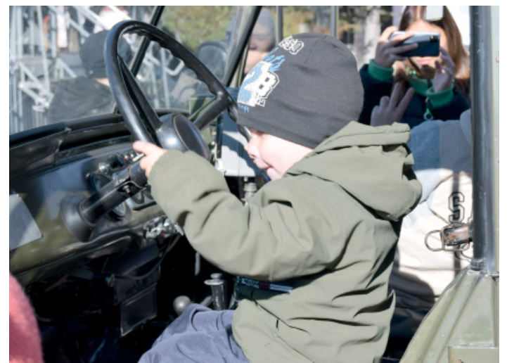
Восторг! – пара минут за рулем большой машины, да еще и военной