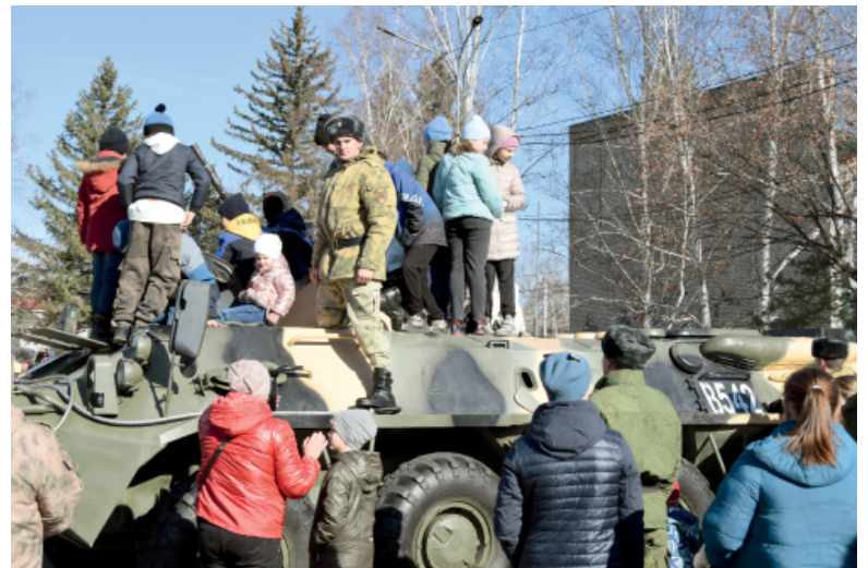
Боевая машина пехоты для детвора – просто интересная техника

Несколько часов все желающие могли знакомиться с тем, что стоит на вооружении войсковой части 3411, потрогать, подержать в руках. Одними двигало любопытство, другие – взрослые – признавались, что было желание увидеть, что наши военные имеют