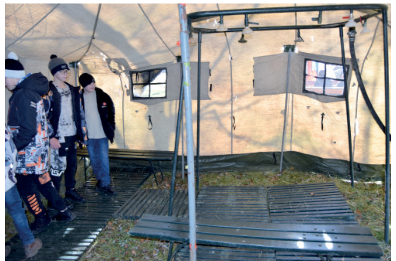
Не просто палатка – полевой душ

необходимое для выполнения поставленных боевых и служебных задач. Убедились – есть и техника, и оружие, а главное – желание не-