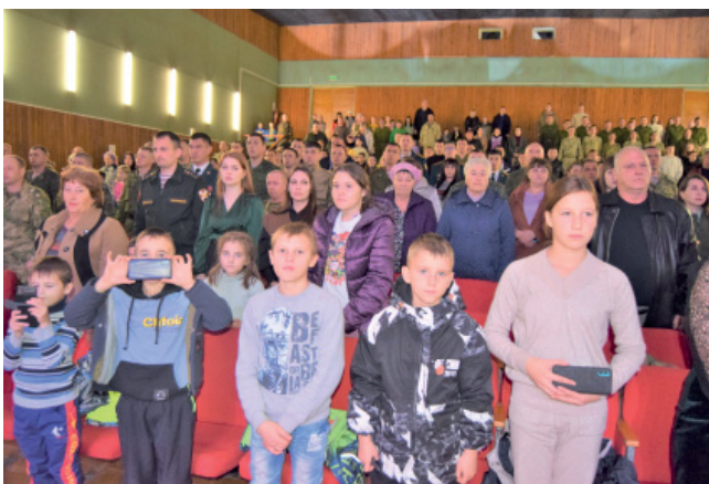
Равнение на знамя! Под звуки гимна России зал встал

С 2020 года у войсковой части 3411 войск национальной гвардии РФ в составе Восточного округа появилась своя символика. Геральдический знак – эмблема войсковой части 3411 – это прямоугольный, закругленный в оконечности и с полукруглыми вырезами в верхней части боковых сторон щит с золотой каймой. В краповом поле щита – круглый щит с золотой каймой со скрепами, за которым золотой меч, поставленный вертикально, рукоятью вверх, и золотое стилизованное изображение атома. В зеленом поле круглого щита – золотая таежная лиана с ягодной гроздью. По сторонам щита в столб – серебряные с золотыми древками протазаны, перевитые краповой девизной лентой с надписью под щитом золотыми литерами: «ВСЕГДА НА СТРАЖЕ».