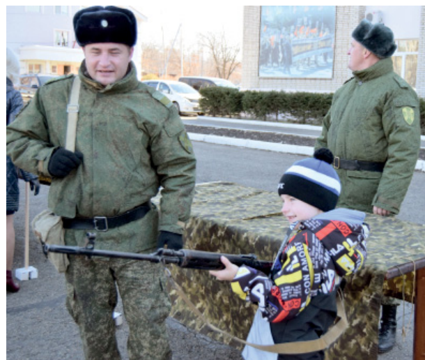
Какой мальчишка не мечтает подержать в руках винтовку