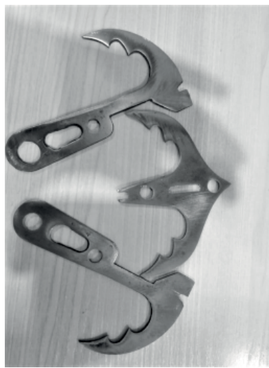
Печка-щепочница, чехольчики для печек, так выглядит «кошка» в разборе