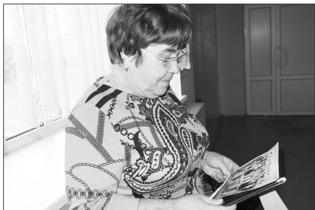
«Как же давно это было, но я всех помню»