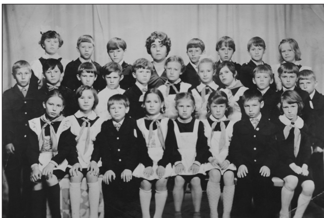
Первая фотография из коллекции выпусков младших школьников