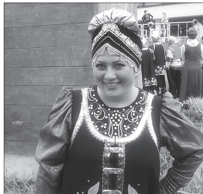
Руководитель и солистка хора «Русский сувенир»

Сейчас уже ни один концерт не проходит без ее участия. Своим исполнением она может поднять настро-