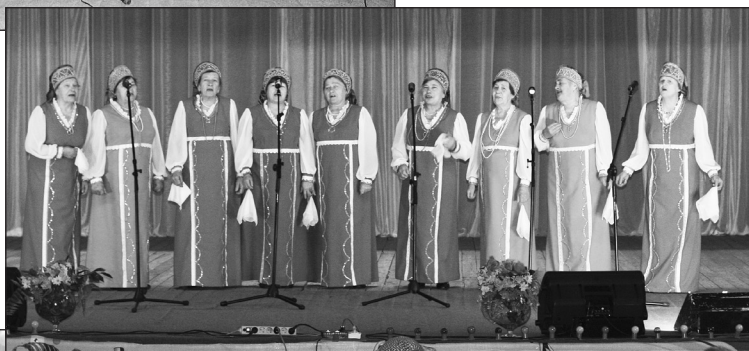
Вокальная группа «Милые женщины», с. Новомихайловка.