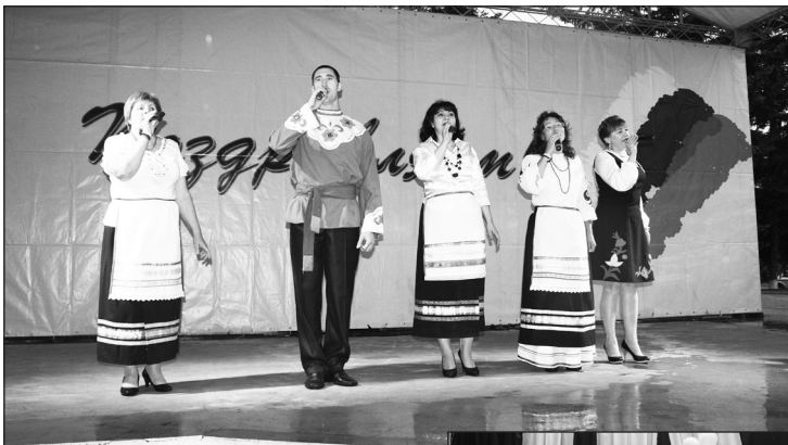
Вокальная группа «ВОЛЕАСА», РДК.

ло, но мы стараемся держать марку. Сейчас готовим фундаментальное, мощное военно-патриотическое произведение «Степи», с которым хор выступит на День Победы и на краевом фестивале «Поющий океан».