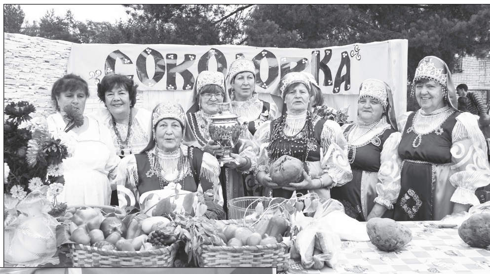
Вокальная группа «Радуга», с. Соколовка

- Нам бы хотелось, чтобы они остались у нас в районе, чтобы сформировалась своя танце-