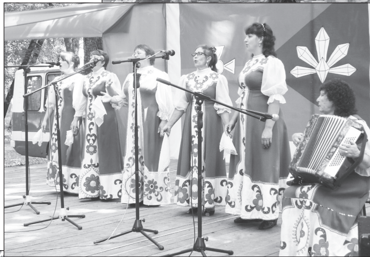
Вокальная группа «Лейся, песня!», с. Каменка