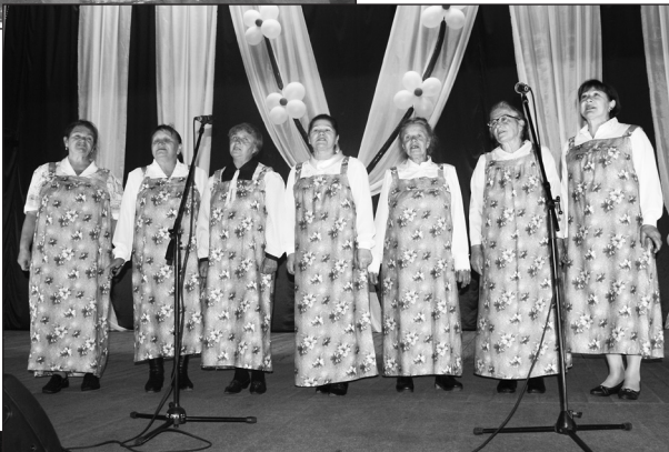
Фольклорная группа «Веснянка», с. Уборка.

ции, которые проходят в районном Доме культуры. Наш коллектив - опытные вокалисты, единомышленники, все как одна семья. Они ценят дружбу внутри коллектива! Я рад, что в хоре поют мужчины: они вдвоём могут исполнить мужскую партию так, будто поют шестеро! Но все же ощущается нехватка мужских голосов;