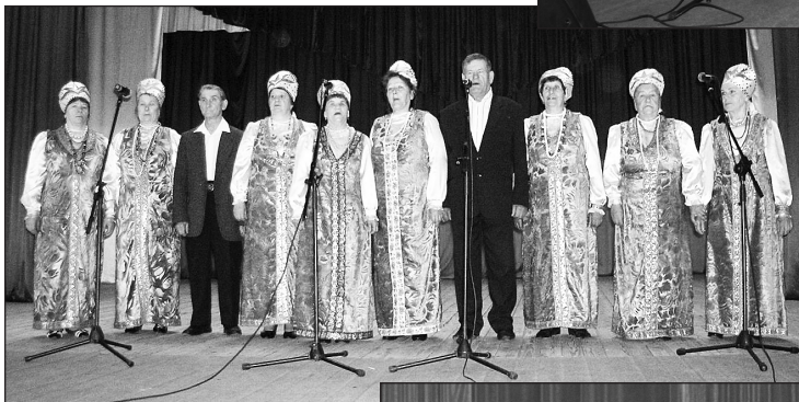
Вокальная группа «Криницы», с. Булыга-Фадеево.

ло, но мы стараемся держать марку. Сейчас готовим фундаментальное, мощное военно-патриотическое произведение «Степи», с которым хор выступит на День Победы и на краевом фестивале «Поющий океан».