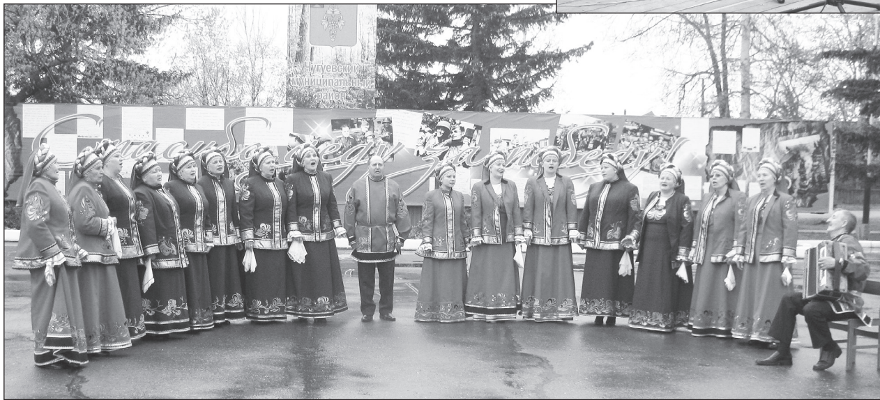
Народный коллектив хор русской песни «Орешина» (РДК)

По среднестатистическим данным, за прошлый год клубами муниципального казенного учреждения «Центр культуры и библиотечно-обслуживания» Чугуевского сель-