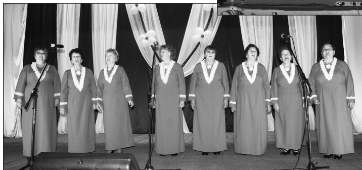
Вокальная группа «Зорюшка», с. Чугуевка

Мне нравится работать с этим коллективом. В хоре поют