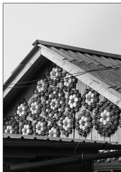
Пластиковый орнамент на крыше

ками»: поскольку никто его не учил работе с деревом, до всего он доходит сам, со-