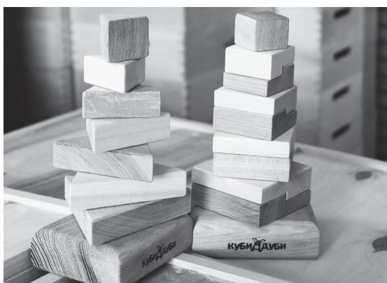
Такие пирамидки сейчас готовятся к выходу в продажу