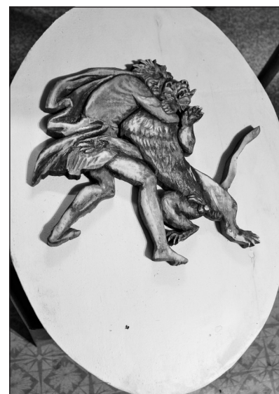
Самсон, побеждающий льва