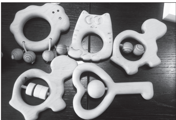
Образцы грызунок для самых маленьких